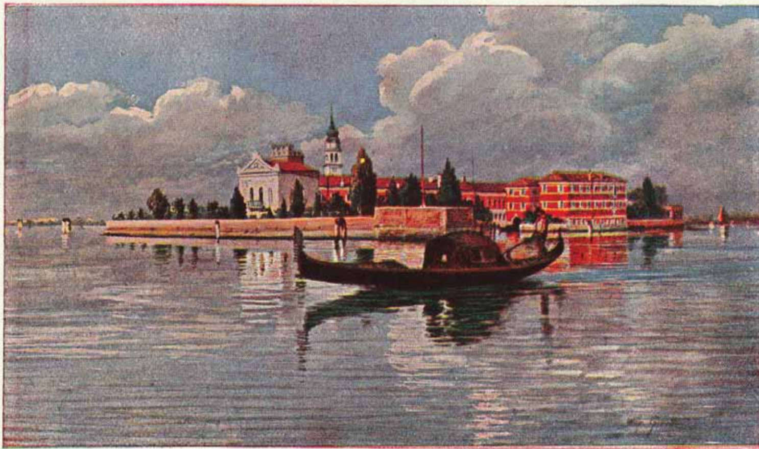
Ս. Ղազար - Մայրավանք Մխիթարեանց

Mechitar morì nel 1749 lasciando una solida realtà religiosa nelle mani del suo giovane successore Melkonian, che la condusse fino al 1800. Seguendo