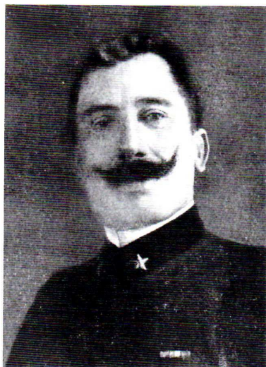
Colonnello degli Alpini GIOPPI ANTONIO Sermide 7 luglio 1863 Monte Pasubio 13 ottobre 1916

Nella ricorrenza dell'anno centenario della Prima Guerra Mondiale, senza nulla togliere agli atti di valore e di abnegazione compiuti da quanti vi parteciparono sacrificandosi con assoluta dedizione, desideriamo ricordare i combattenti, nati in provincia di Mantova o legati ad essa da rapporti di vario genere, che furono decorati di Medaglia d'Oro al Valor Militare riportandone le motivazioni "a memoria del passato e a incoraggiamento nel presente, esempio e monito per l'avvenire".