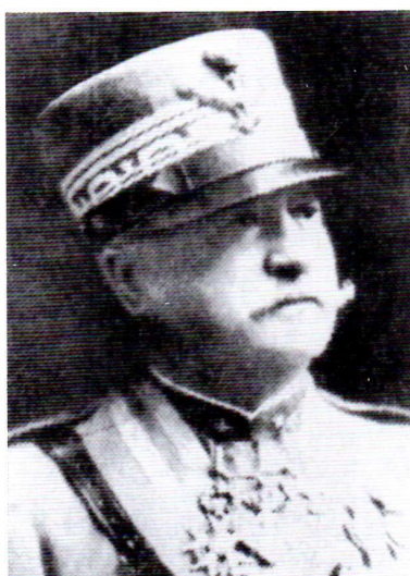
Generale di Divisione GONZAGA del VODICE MAURIZIO Venezia 21 settembre 1861 Roma 1938