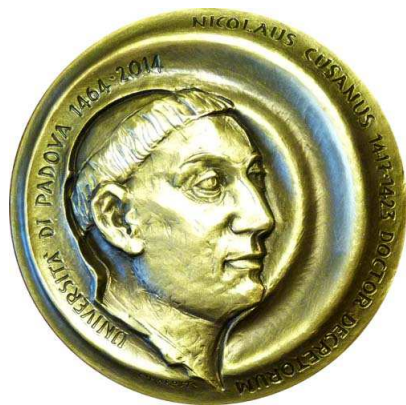
Figure geometriche e motti latini per il rovescio (source: author)

Un plastico e lineare ritratto di Nicolò Cusano per il dritto della medaglia patavina (source: author)