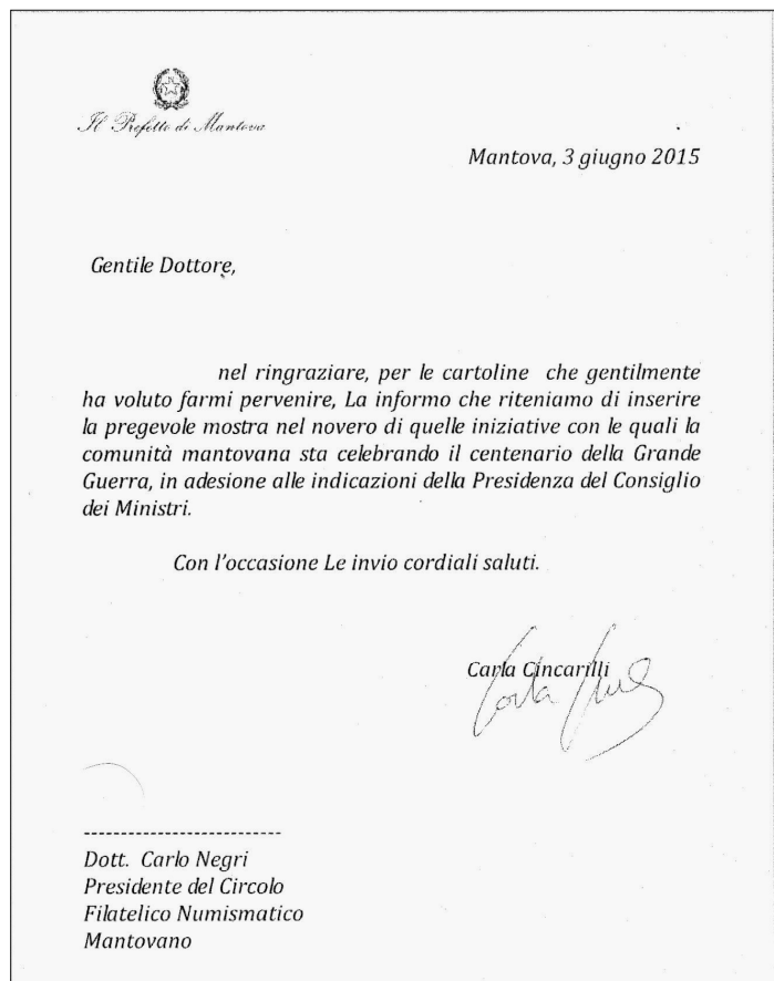
Una lettera che ci onora ed inorgoglia e rende soddisfazione a quanti si sono prodigati per un'ottima riuscita della mostra.