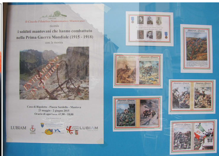
Richiamo e pubblicità all'ingresso della Casa di Rigoletto: la locandina e le sei cartoline ricordo.