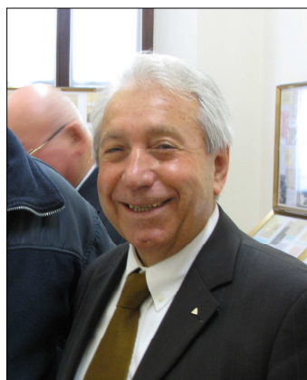
... viene ricompensato immortalandolo con questo smagliante sorriso.

Al momento (metà giugno) della preparazione di questo notiziario è ancora disponibile un ridotto quantitativo di cartoline.