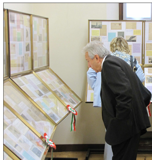
Il Presidente Longfils, dimostratosi veramente interessato ...