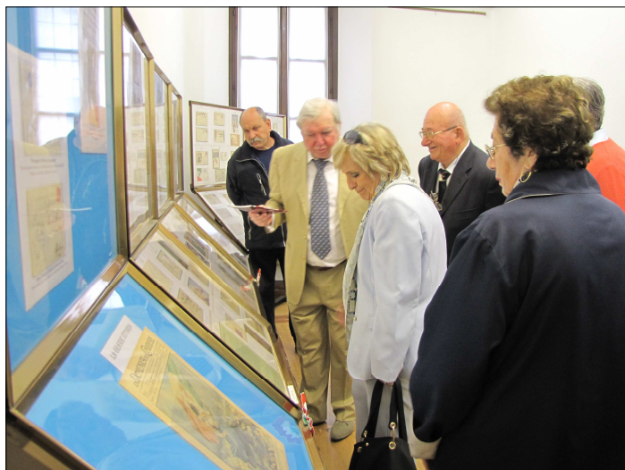
Il pubblico interessato ascolta le spiegazioni fornite dal Presidente Negri al Prefetto Carla Cincarilli.

"Saluti e baci" dalla Fronte; le Cartoline postali in Franchigia italiane per la Grande Guerra 1915 - 1918