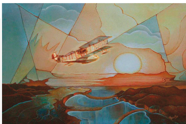
Aeropittura Sig.ra Marcella Mencherini

ORARIO Sabato 26 h 10.00 - 20.00 Domenica 27 h 10.00 13.00 h 16.00 20.00