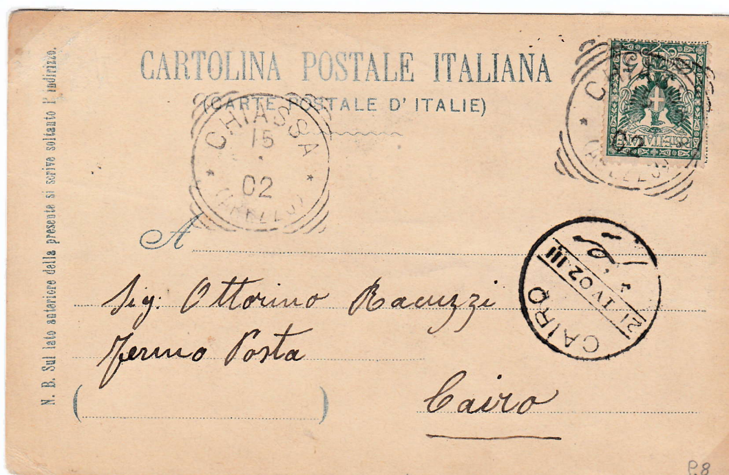
15...1902. Tondo riquadrato CHIASSA *(AREZZO)*, privo di indicazione del mese, su cartolina per Cairo.