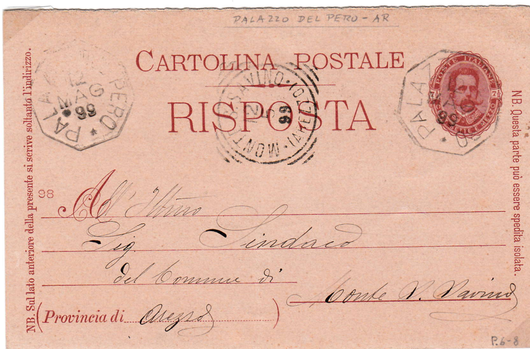
12. 5. 1899. Ottagonale di PALAZZO DEL PERO su intero postale per Monte S. Savino.

Nel 1900 è ancora collettoria di 1° Classe.