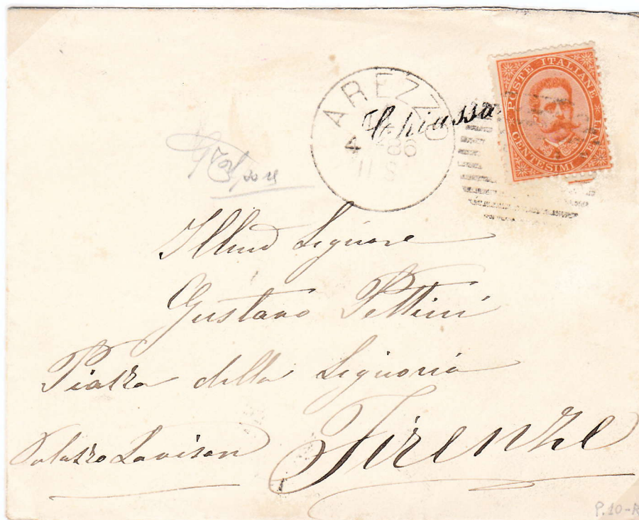
14. 4. 1886. Bustina per Firenze, con il corsivo di collettoria Chiassa , accompagnato da grande cerchio e numerale a sbarre di Arezzo.

2° Cl.: già in funzione al 1.4.82 Bollo: corsivo Nel 1900 era collettoria di 1° Classe. Il tondo-riquadrato è conosciuto nel periodo 1899-1902.