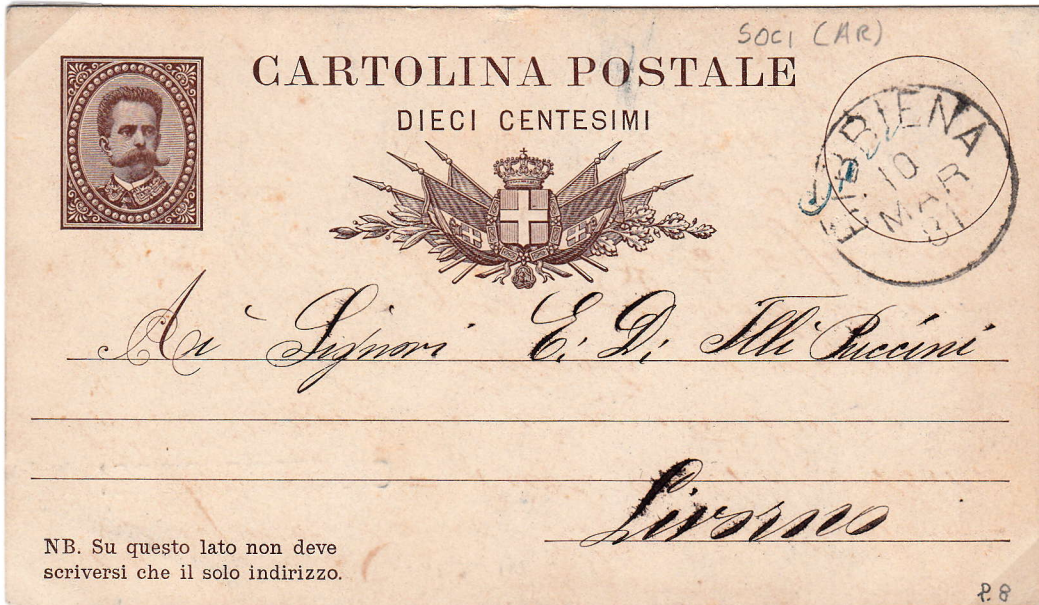
10. 3. 1881. Intero postale da Soci a Livorno, transitato da Bibbiena.

Ad inizio del '900 era ufficio postale di 2° Classe. Il bollo tondo-riquadrato è noto dal 1898 al 1913.