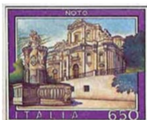
Noto Barocca La Chiesa di San Domenico con la Fontana d'Ercole