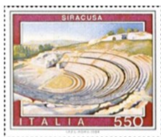
Siracusa Il Teatro Greco

Vieni a trovarci non come semplici turisti, ma come graditi ospiti. Non ve ne pentirete. VI ASPETTIAMO.