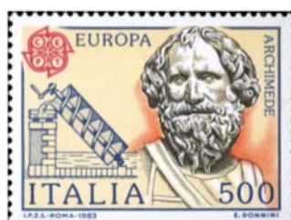
Siracusa Archimede, il più grande scienziato dell'antichità