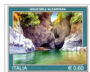
Le Gole dell'Alcantara Un vero spettacolo della natura (Taormina)