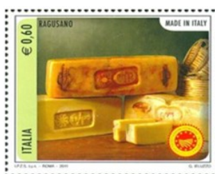
Ragusa Caciocavallo Formaggio DOP