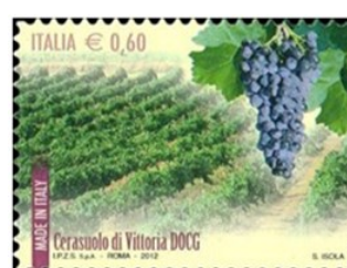
Vittoria Vino Cerasuolo DOCG