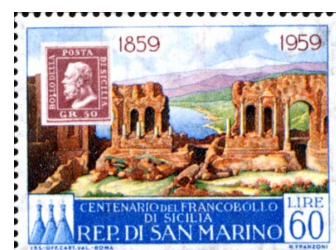
Taormina Il Teatro Antico