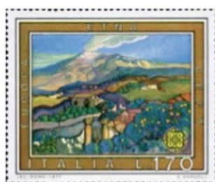
l'Etna Il Vulcano più alto d'Europa: