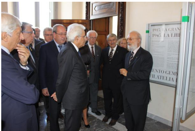
E in questa foto lo vediamo appunto al Quirinale mentre si accinge a spiegare al Presidente Mattarella e ad altri invitati la grande mostra da lui organizzata nel sito più prestigioso della Repubblica.

Ciò che l'ha reso più conosciuto al largo pubblico sono stati gli incarichi di curatore scientifico e organizzativo alle grandi mostre di storia e posta presso la Camera dei Deputati in Palazzo Montecitorio del 1999, 2003, 2006 e 2011. In particolare quella del 2015 al Quirinale, La Grande guerra. La Liberazione. Cento gemme della filatelia italiana .