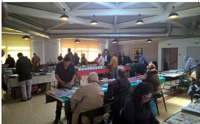
Il primo convegno a Bagnolo San Vito