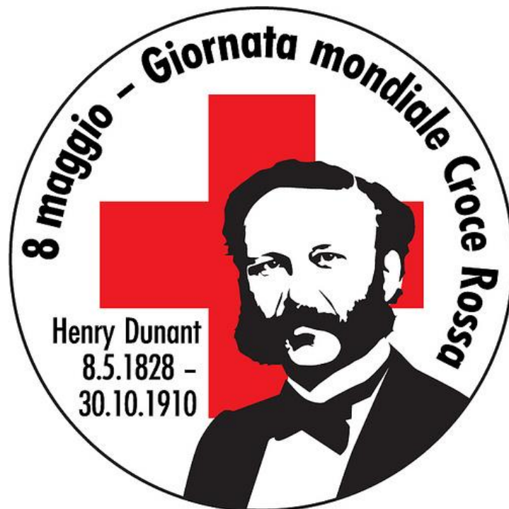
Cartolina illustrata edita dalla UNION POSTALE UNIVERSELLE