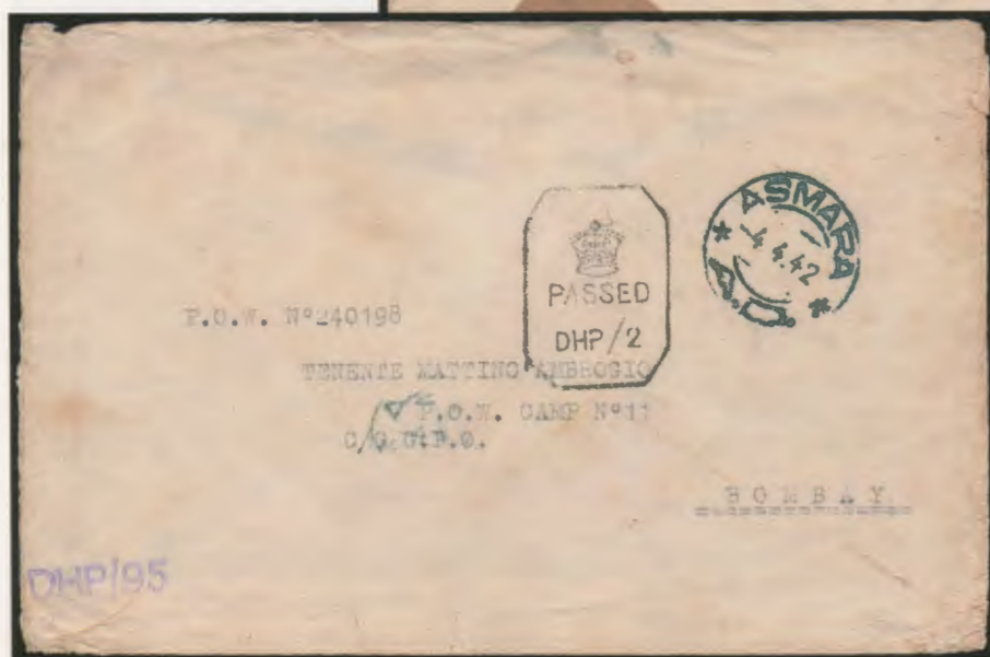
4 aprile 1942. Busta di lettera prestampata del procuratore del Re, inoltrata in franchigia da Asmara e diretta a un prigioniero italiano in un campo di Bombay. Sul frontespizio il bollo della censura britannica.