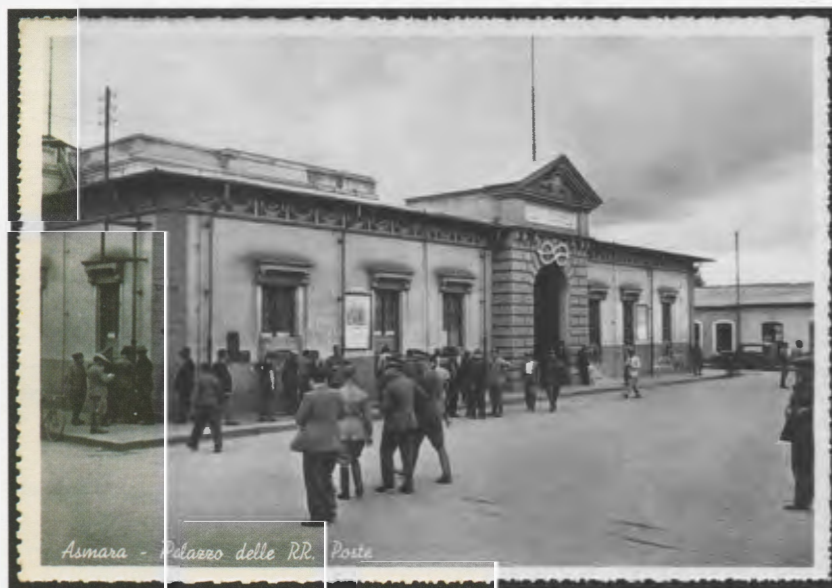
Asmara - Palazzo delle RR. Poste

Per l'Italia il servizio è limitato alle lettere ordinarie e raccomandate ed alle cartoline postali non illustrate. Il peso massimo consentito per ogni lettera è di 40 grammi. La corrispondenza può essere inoltrata anche per via aerea; da notarsi, però, che l'inoltro aereo è fino all'Egitto, e successivamente ordinario.