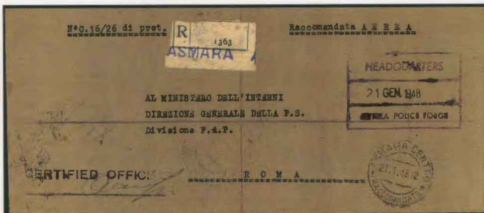
21 gennaio 1948. Busta di lettera raccomandata inoltrata dal Quartier Generale "Eritrea Police Force" da Asmara diretta a Roma alla Direzione Generale della P.S. del Ministero degli Interni.

Alcuni enti pubblici amministrativi o politici disponevano della franchigia postale. Sul frontespizio della corrispondenza veniva applicato il bollo dell'ufficio abilitato alla franchigia e la firma del funzionario responsabile dell'ufficio.