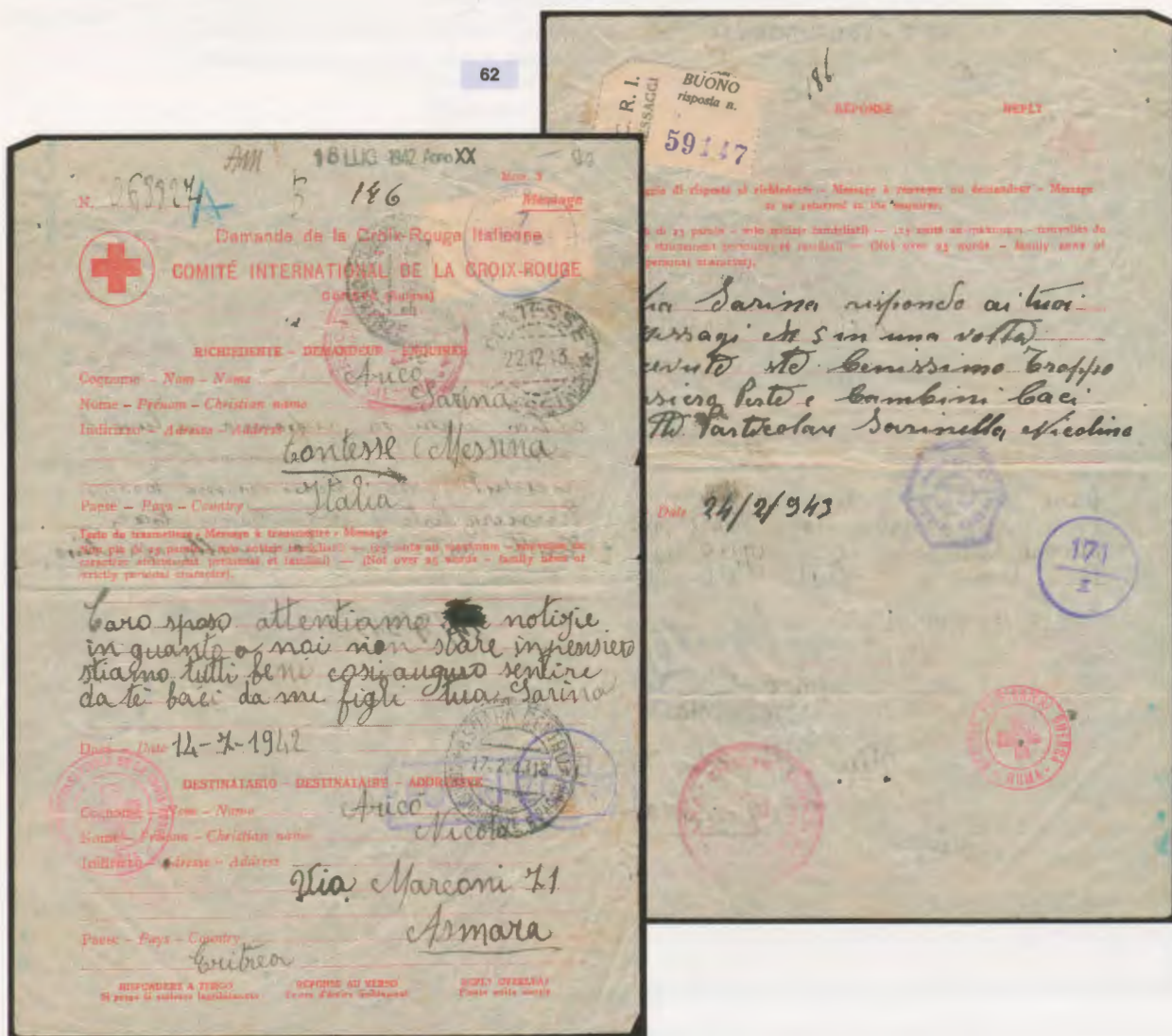
14 luglio 1942. Modulo del Comitato della Croce Rossa di Ginevra da Messina ad Asmara dove arriva il 17.2.43. La risposta del 24.2.43 giunge a Messina il 22.12.43. Sul modulo vari bolli postali di transito e di arrivo, bolli della censura britannica e di quella italiana, e bolli degli uffici della Croce Rossa.

Si tratta generalmente di moduli prestampati, ripiegati in due parti contenenti l'indirizzo del mittente e del destinatario. Il modulo contiene il messaggio di andata e quello della risposta di ritorno. I moduli prestampati sono emessi o dai vari comitati nazionali della Croce Rossa o da quello della sede internazionale di Ginevra. La modulistica è alquanto varia anche perché vari comitati locali ne disponevano di tipi diversi. Sono presenti i vari timbri dei comitati, quasi sempre uno o più timbri di transito delle varie commissioni di censura sia del paese di origine che di transito o di arrivo e spesso anche i timbri dei vari uffici postali di transito o timbri con datario di riferimento.