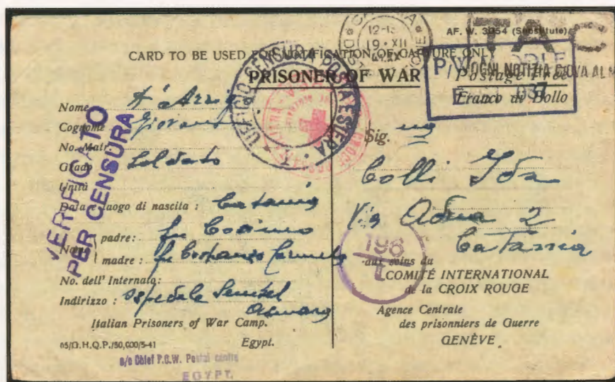
3 agosto 1941. Cartolina con diciture prestampate per prigionieri di guerra, scritta da un prigioniero italiano presso l'ospedale Semebel di Asmara e diretta a Catania. Sulla cartolina i bolli della censura britannica e di quella italiana di Roma, il bollo del comitato della Croce Rossa e il bollo postale di arrivo di Catania del 19.12.41.