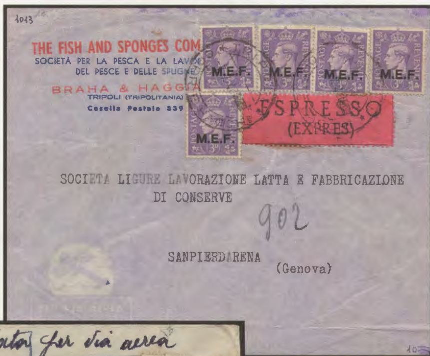
7 luglio 1948. Busta di lettera via aerea inoltrata per espresso da Tripoli a Genova, affrancata con cinque esemplari da 3 d. Al verso bollo di transito di Roma e di arrivo del 9.7.48.