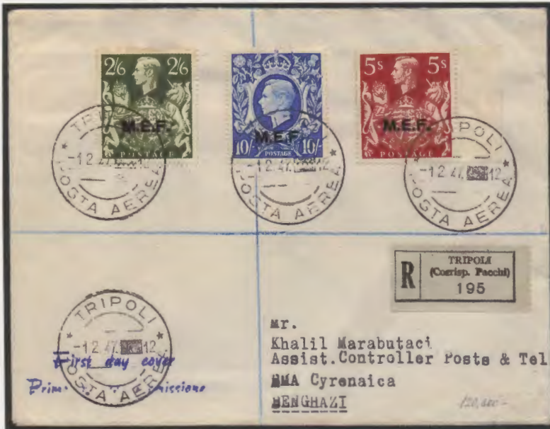
1° febbraio 1947. Busta di lettera raccomandata via aerea da Tripoli a Bengasi affrancata con i tre alti valori della serie: il 2/6, il 5 ed il 10 scellini. Al verso il bollo di arrivo di Bengasi.