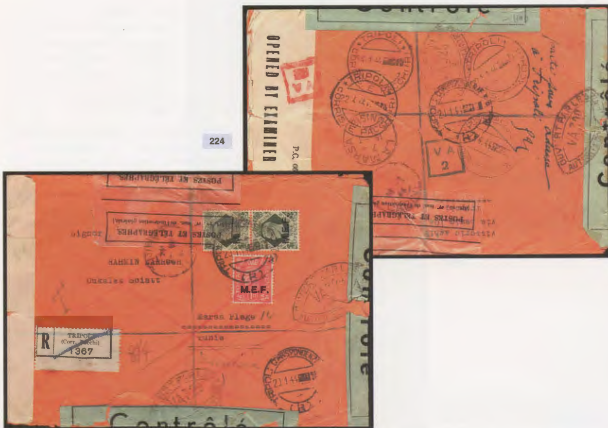
20 gennaio 1944. Lettera raccomandata via aerea da Tripoli per la Tunisia affrancata con un valore da 1 d. ed una coppia del 9 d. Fascette e bolli della censura francese e bollo di arrivo del 15.3.44.