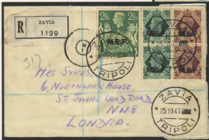
25 ottobre 1943. Busta di lettera raccomandata da Zavia a Londra affrancata con due esemplari del 9 d., due da 1 scellino e un 2/6. Fascetta e bolli della censura egiziana.