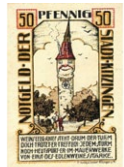
Germania - Municipalità di Kitzingen. L'antica torre del Falterturm, emblema cittadino del XV secolo, riportata con volto umano in un biglietto da 50 pfennig del 1921