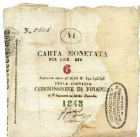
Assedio di Palmanova. Prima Guerra d'Indipendenza, Carta monetata 6 Lire 1848

vampano in tutta Italia e, a seguito dei moti viennesi, anche Venezia insorge contro il dominio austriaco e da lì a poco iniziarono le Cinque Giornate di Milano con la conseguente liberazione della capitale del Lombardo Veneto dal dominio asburgico. Arretrando verso Udine, l'esercito austriaco al comando del generale Nugent, pose 4 battaglioni ad assedio della città fortificata di Palmanova e ad Osoppo. Al comando del vecchio generale Zucchi, la "città fortezza" di Palmanova resistette al lungo assedio nemico. In quell'occasione la Commissione Finanza decisa di emettere monetazioni di necessità sottoforma di banconote. Vennero emessi vari tagli di banconote per un totale di 60.000 lire. Stampate usando inchiostro nero, la data in