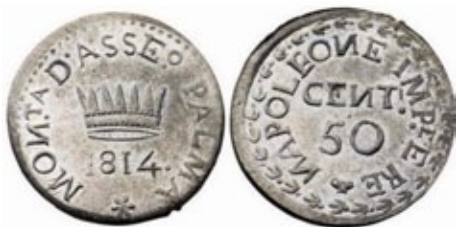
Assedio di Palmanova, 50 centesimi 1814

vampano in tutta Italia e, a seguito dei moti viennesi, anche Venezia insorge contro il dominio austriaco e da lì a poco iniziarono le Cinque Giornate di Milano con la conseguente liberazione della capitale del Lombardo Veneto dal dominio asburgico. Arretrando verso Udine, l'esercito austriaco al comando del generale Nugent, pose 4 battaglioni ad assedio della città fortificata di Palmanova e ad Osoppo. Al comando del vecchio generale Zucchi, la "città fortezza" di Palmanova resistette al lungo assedio nemico. In quell'occasione la Commissione Finanza decisa di emettere monetazioni di necessità sottoforma di banconote. Vennero emessi vari tagli di banconote per un totale di 60.000 lire. Stampate usando inchiostro nero, la data in