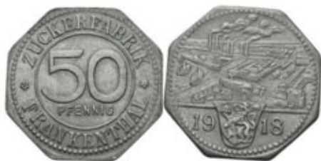
Germania - Frankenthal. Gettone Notgeld da 50 pfennig 1918. Alluminio - Emesso dal Zuccherificio cittadino

Nella prima metà del XX secolo (per lo più dal 1914 al 1948) molte nazioni utilizzarono la monetazione notgeld (Russia, Italia, Francia, Belgio, Ungheria solo per citarne alcune) e servivano per far fronte alla carenza di monete spicciole poiché il metallo necessario venne impiegato per la produzione di armamenti e forniture belliche. I notgeld furono principalmente monete in forma cartacea (simile a banconote) ma furono usate anche monete metalliche di metalli meno versatili (soprattutto zinco o alluminio, non utili per la produzione di armi), ma anche stoffe (seta, lino – Leinengeld – e pellame vario) o porcellana