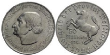
Germania – Westfalen, 50 milioni di Marchi 1923, 8 grammi, 44 mm

di l'alternativa durevole (almeno fino alla scadenza del biglietto) per piccoli pagamenti. Moltissime comunità predisponavano la stampa di biglietti pubblicizzando la cultura locale e molto spesso edifici e panorami. Spiccavano per colori e fantasia artistica al punto che ancora oggi, queste emissioni sono collezionate e apprezzate.