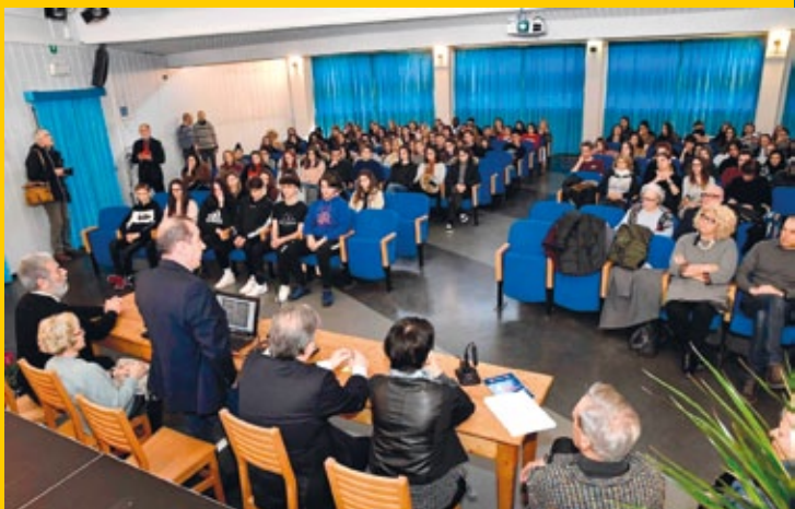
Liceo Filzi Rovereto, Giornata della Memoria, 27.01.2020