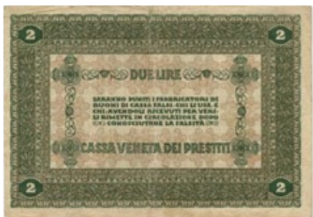
Cassa Veneta dei Prestiti. Buono da 2 Lire, 2 gennaio 1918