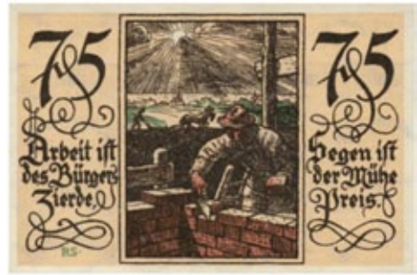
Germania – Rotenburg, 75 pfennig 1921

(porzellangeld) come quelle prodotte dalla municipalità di Dresda e altre città perlopiù in Sassonia e Vestfalia. In alcuni casi anche alcune forme stampate di carta o cartone (come ad esempio alcune particolari carte da gioco – spielkarton – rarissime oggi sul mercato collezionistico).