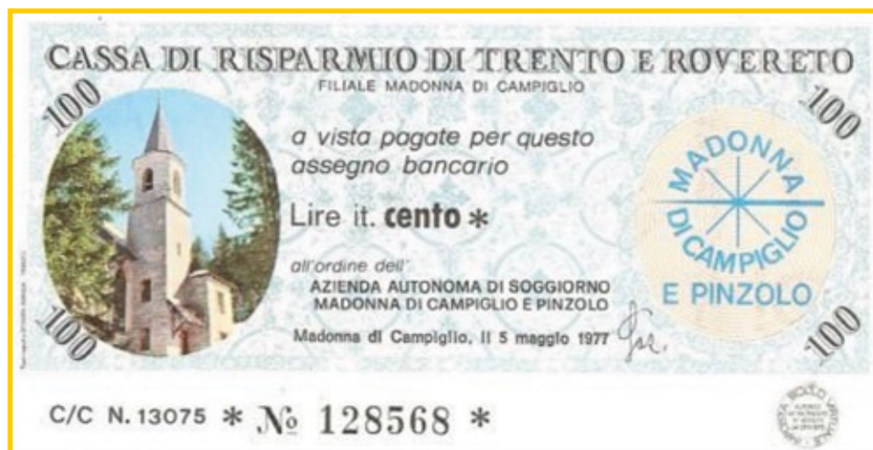
Miniassegno da 100 Lire emesso il 5 maggio 1977 dalla filiale di Madonna di Campiglio della Cassa Di Risparmio Di Trento e Rovereto

Nel resto del mondo troviamo una recente forma di monetazione d'emergenza fu emessa nel momento più acuto della crisi economica argentina del 2001. I governi provinciali pagarono i loro dipendenti e i fornitori di servizi con dei buoni che sarebbero stati convertiti in futuro in regolare peso argentino (Bono Patacón).