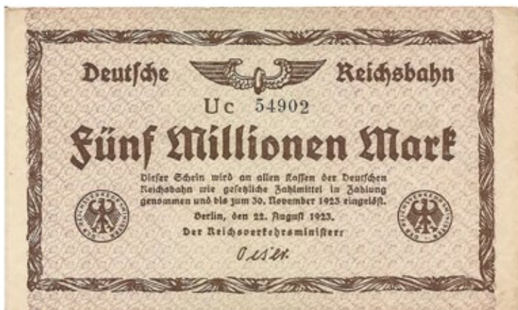
Banconota uniface da 5.000.000 di Marchi, 22 agosto 1923

In quel periodo i biglietti notgeld ave-