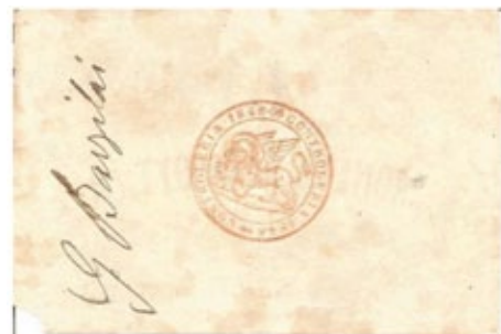
5 Lire - Moneta Patriottica, 16 settembre 1848. Al retro timbro e firma di Barzilai