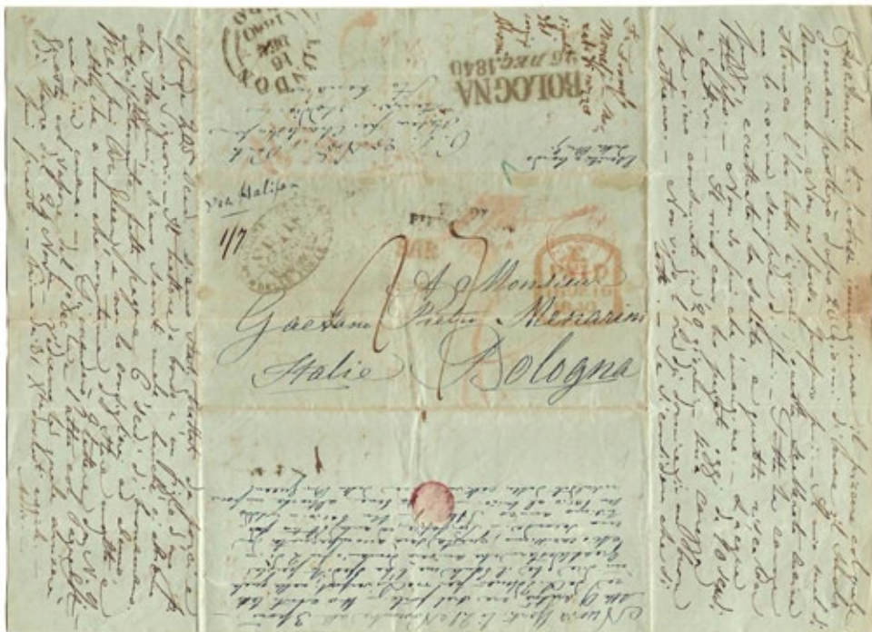
La “facciata” della lettera, aperta per mostrare come tutti gli spazi possibili sono stati occupati dalla scrittura. Con quello che costava allora nessun pezzo di superficie cartacea utilizzabile è stato trascurato!

(era il 1°Nov.) non si partì perché il tempo era troppo scellerato; Ieri soltanto alle 7 ½ antime[ridiane], si partì. Il vento contrario, e violento; però a mezzo di si voltò in nostro favore, e lo è stato fino ad oggi a mezzo di. Ora è contrario ma è debole e il vapore se ne suggerà. Fino ad ora il mal di mare mi ha fatto grazie. Sto perfettamente; altro che il mal di stomaco che con questa infame cucina aumenta invece di calare. – Siamo di già sull'Atlantico, et on file que c'est un plaisir. Tutte le signore sono a che stanche[?] e non si è anche aperto il piano. Addio. –