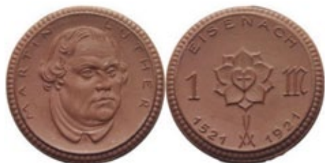
Germania - Eisenach. Mark 1921 in porcellana bruna, 5,5 gr – 31 mm