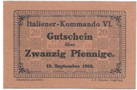
Buono (Gutschein) uniface 20 pfennig del settembre 1918 - Italiener-Kommando VI

Gli ultimi biglietti kriegsgeld furono stampati il 1° novembre del 1918 in autonomia dal comune di Bolzano poco prima dell'armistizio per rimediare alla mancanza di monete a causa del trasloco della banca nazionale austro-ungarica in territorio austriaco. Vennero quindi stampati dei vaglia il cui rimborso era garantito dalle casse cittadine. L'imminente apertura degli sportelli della Cassa di Risparmio di Bolzano indusse la stampa di nuovi biglietti ma il comando militare italiano appena