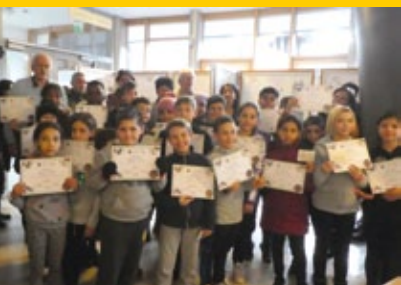
Scuola Primaria Marco, 01.01.2020

Costante poi in ogni scritto di quei tempi è la cura e l’attenzione riservata alla posta: quella che si attende e quella che si spedisce. Ed anche il Nostro non si risparmia nello scrivere e nel raccontare e cerca sempre le vie più sicure e veloci per l’inoltro delle sue missive.