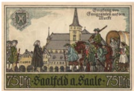
Un variopinto biglietto notgeld tedesco. Germania – Saalfeld – 75 pf, 7 maggio 1921

Nel marzo 1848 i moti insurrezionali di-