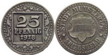
Monetazione di Guerra (Kriegsgeld). Germania - Münster, 1918 - 25 pfennig - ferro

La prima metà del 1920, la produzione di biglietti notgeld stampati dalle piccole municipalità austriache e tedesche, era considerato dalle comunità rurali l'unico metodo di pagamento valido per la distribuzione di beni di consumo. Le piccole comunità, in molti casi con meno di 1000 abitanti, basavano la quotidianità economica sullo scambio di servizi con merci e prodotti. La monetazione notgeld era quin-