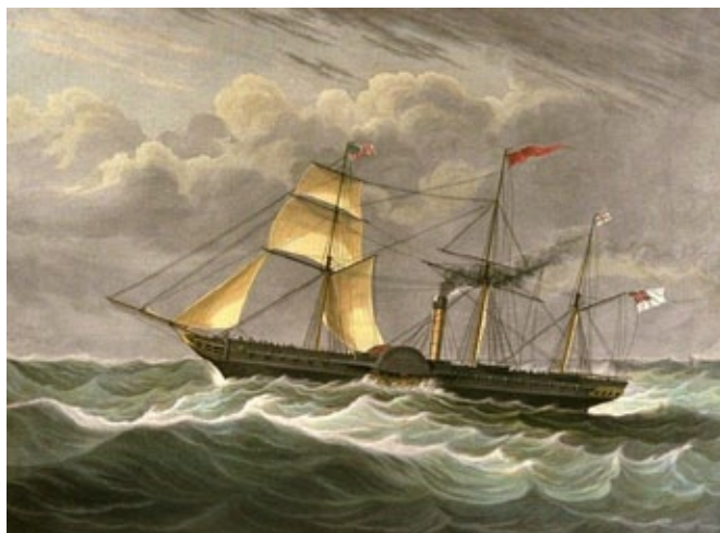
La “British Queen”.

È una lettera scritta a bordo della “British Queen”, un vapore non a contratto, un “pioneer steamer” come vengono definiti in letteratura, che era allora viaggiava per conto della British & American Steam Navigation Company, una società di navigazione che iniziò i suoi viaggi in maniera provvisoria solo il 1° luglio 1840 e che una volta stipulato un regolare contratto con il governo britannico intraprese viaggi regolari dal 1° settembre 1840.