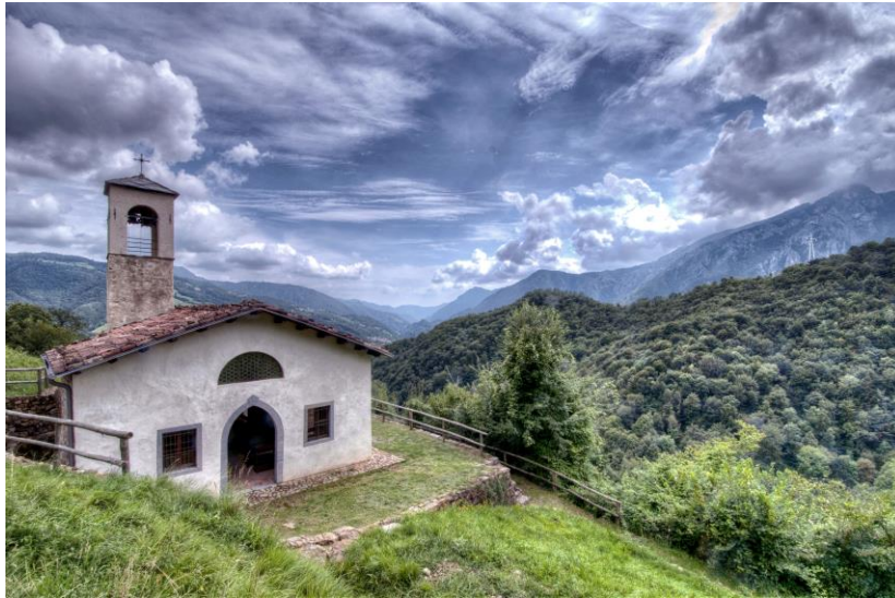
Chiesa di San Ludovico (ph. Stefano Bombardieri)