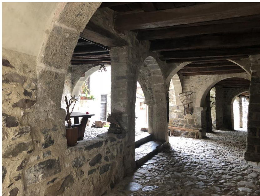
Portici di Cornello