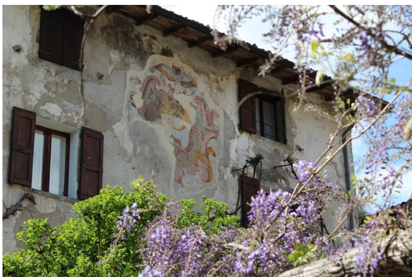
Stemma dei Tasso nel Palazzo Tasso Cornello