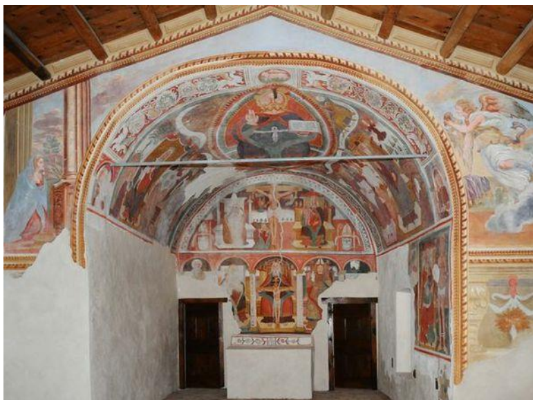
La chiesa affrescata di San Ludovico di Tolosa nel borgo di Bretto