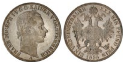
Vereinstaler "Tallero di Convenzione" 1858 Zecca di Vienna Argento 900‰ – 33 mm – 18,52 gr

Quindi la necessità di standardizzare la monetazione nel centro-nord Europa era fondamentale per poter rafforzare i rapporti economici che in quel periodo iniziavano a proliferare. Dopo diversi tentativi di standardizzazione della monetazione si giunse al Trattato di Vienna del 1857 nel quale si sancì l'adozione, negli stati di area germanica, del nuovo standard monetale imposto dallo Zollverein : il Vereinstaler (ovvero tallero di convenzione ).