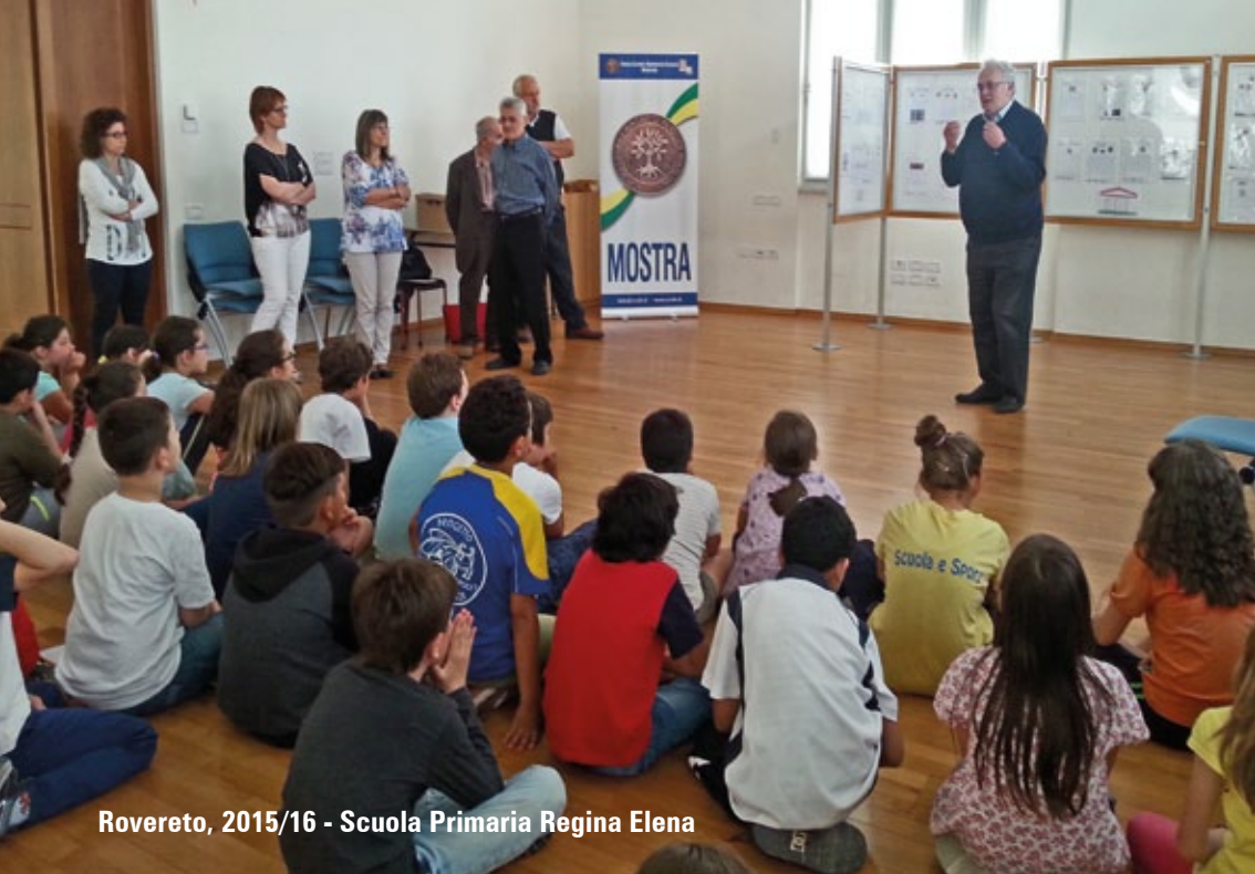
Rovereto, 2015/16 - Scuola Primaria Regina Elena