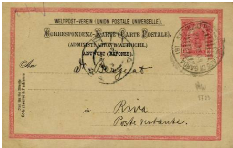
Foto 09. 21 aprile 1905. Bollo (6) annul- latore di una cartolina postale austriaca da 10 m heller per Riva.