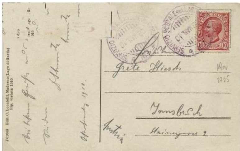
Foto 11. 23 marzo 1910. Bolli (7) su 10 c. di Vittorio Emanuele III su cartolina illu- strata per l'Au- stria.