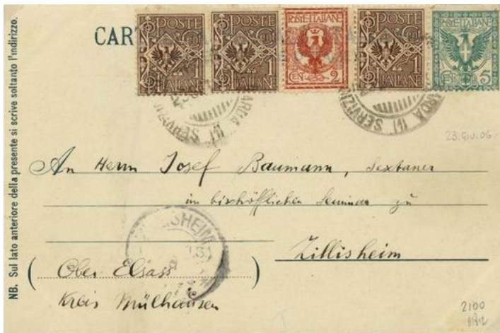
Foto 02. 23 giugno 1906. Bollo (1) annullatore di una bella affranca- tura tricolore di 10 c. su una cartolina illu- strata per l'Alsazia.