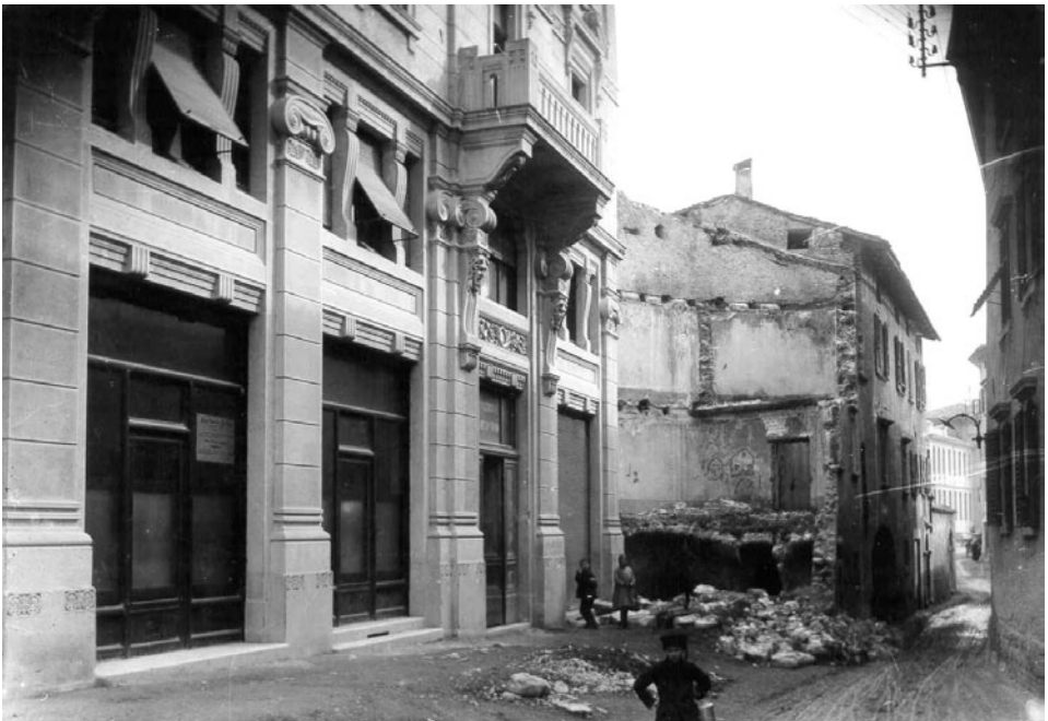
Rovereto, via G. Tartarotti

Questa forzata antropizzazione cambiò repentinamente e radicalmente il volto della montagna: le vecchie vie di percorrenza, i pascoli, gli alpeggi, le dimore, le fonti, vennero dismessi o razziati o distrutti; ma nuovi sentieri, mulattiere, gallerie, strade (400 km di carreggiabili e camionabili nel solo Trentino) furono tracciati. Lo spazio alpino fu attraversato da linee telefoniche aeree, condotte d'acqua, teleferiche e funivie, nuove ferrovie (Val di Fiemme, Val