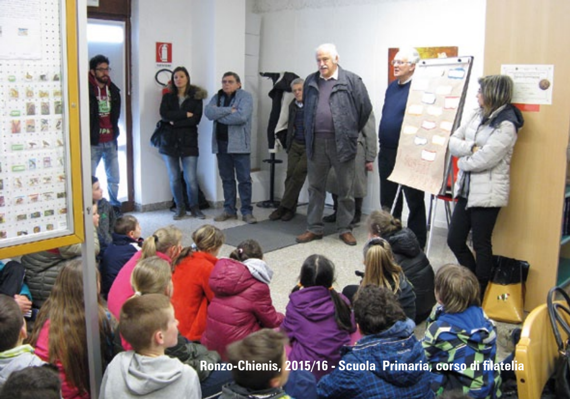
Ronzo-Chienis, 2015/16 - Scuola Primaria, corso di filatelia