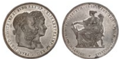
2 fiorini 1879 - Zecca di Vienna (A) Commemorativa del 25° anniversario di Matrimonio Argento 900‰ – 36 mm – 24,69 gr

Quasi tutte le tipologie monetali ufficiali coniate hanno avuto come oggetto