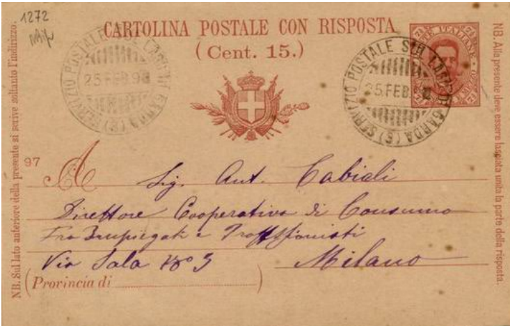
Foto 05. 25 febbraio 1898. Bollo (3) su una "cartolina postale con risposta" da 15/7,5 c. per Mi- lano.