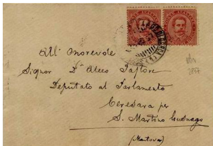
Foto 01. 23 luglio 1897. Bollo con barrette nelle lunette “Servizio postale sul lago di Garda (1) su due francobolli da 10 c. di Umberto I su lettera per Ceresara.