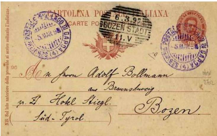
Foto 06. 5 marzo 1897. Bollo (4) in az- zurro vivo su una "cartolina postale italiana" da 10 c. per Bolzano allora austriaca.