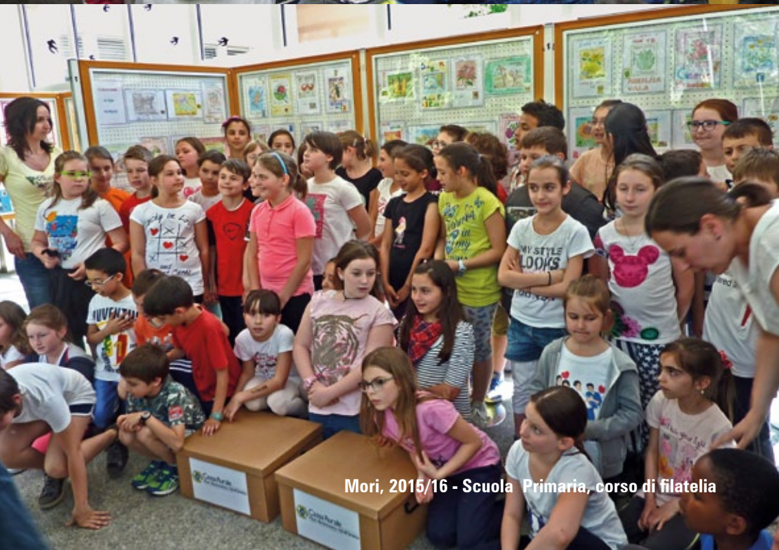
Mori, 2015/16 - Scuola Primaria, corso di filatelia