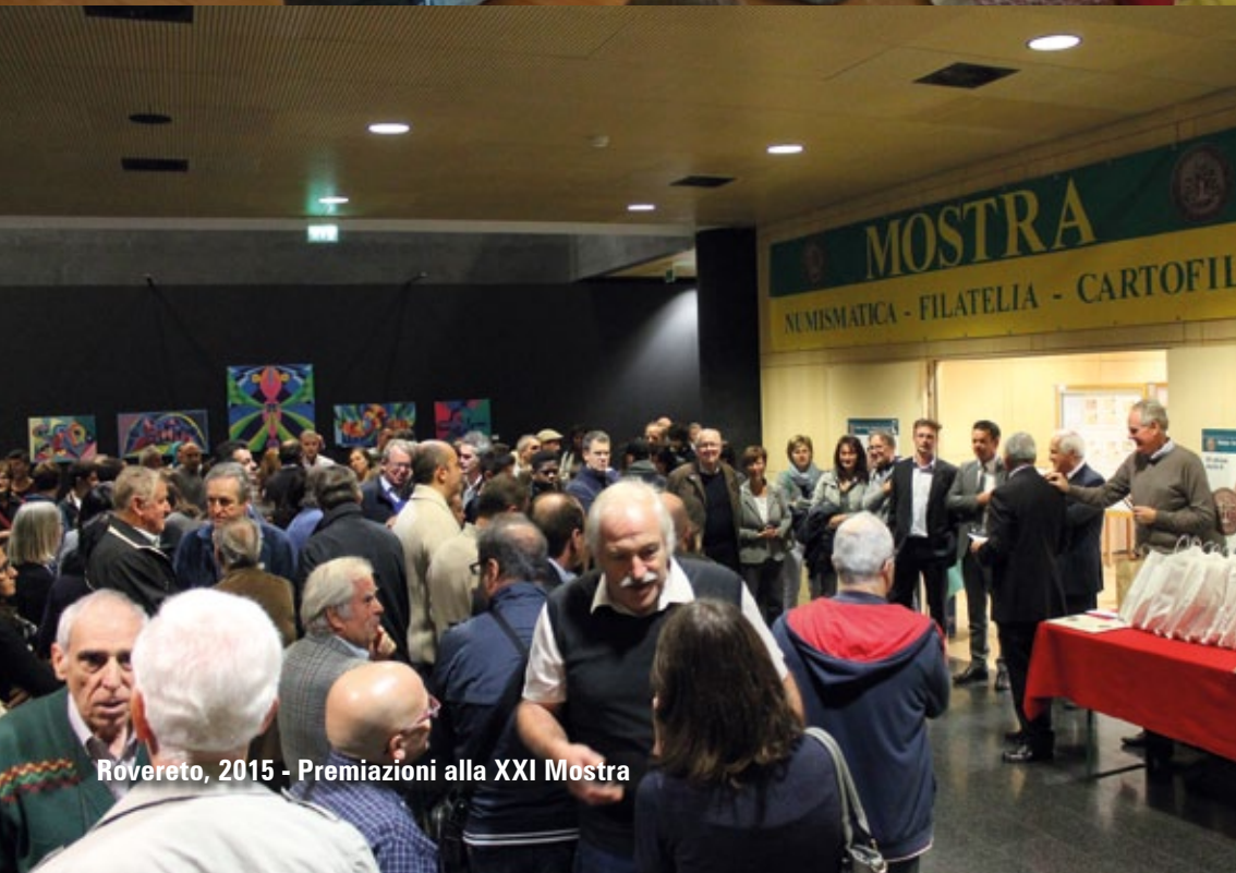
Rovereto, 2015 - Premiazioni alla XXI Mostra