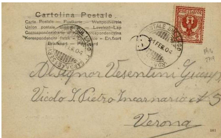
Foto 08. 21 febbraio 1904. Bollo (5) su 2 c. su cartolina illu- strata (stampa) per Verona.