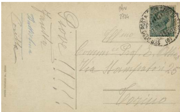
Foto 10. 7 settembre 1910. Bollo (6) su 5 c. di Vittorio Emanuele III su cartolina illustrata per To- rino.