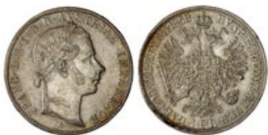
Fiorino del tipo 1858 Zecca di Vienna Argento 900‰ – 29 mm – 12,35 gr

Trattandosi di uno standard basato sul valore del metallo nobile, nella produzione