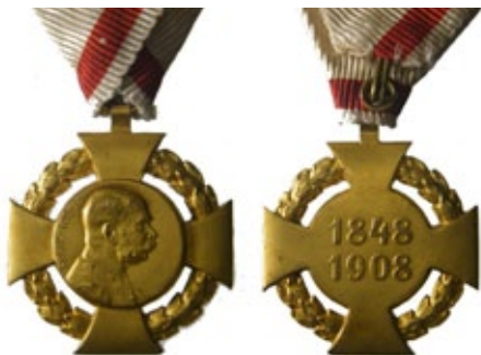
Croce per il 60° anno di regno. Concessa in 2 classi (oro e diamanti e bronzo dorato)

per la cultura, l'economia e per la società austriaca. Sono da ricordare sicuramente le numerose medaglie prodotte per commemorare gli anniversari di regno (nel 1873, 1898 e 1908 rispettivamente per il 25°, 50° e 60°). Per queste occasioni vennero prodotte medaglie militari consegnate a militari di ordine e grado che si erano distinti per meriti sul campo, oppure ad addetti della pubblica amministrazione. Inoltre per queste occasioni molte associazioni pubbliche o private diedero mandato di far coniare medaglie commemorative