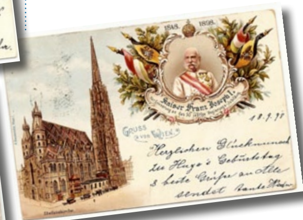
Alcune cartoline viaggiare ritraenti immagini popolari di Francesco Giuseppe