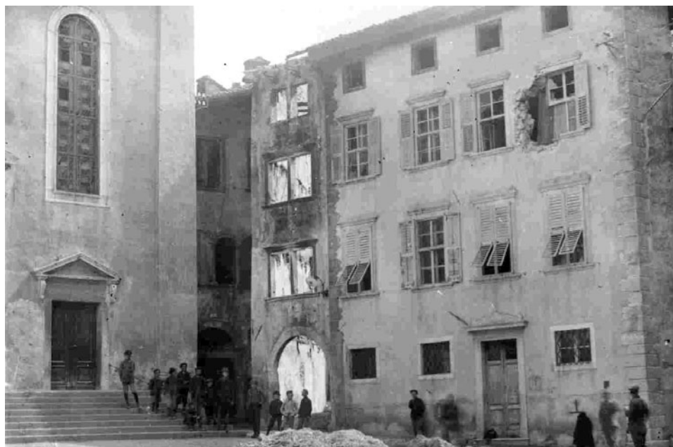
Rovereto, piazza San Marco

Combattuta in un ambiente ostile, in cui la natura era il terzo, forse più pericoloso, contendente, la guerra trasformò gli uomini della montagna in "soldati-ricercatori", costringendoli a usare le loro cono-