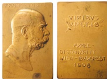
Placca in bronzo prodotta per la Gara di resistenza di corsa per forze armate Vienna Budapest tenuta il 7/8 ottobre del 1908 (Opus Marshall - Pittner - 79,6 grammi)

La scuola medagliistica austriaca nella seconda metà del XIX secolo ebbe il suo periodo più fiorente, quando le esperienze artistiche e le tecniche di coniazione contribuirono a rendere realmente onnipresente l'effigie del kaiser , nella immensa varietà di medaglie prodotte. Alle molte medaglie di destinazione militare e governative, si aggiunsero coniazioni ufficiali e produzioni private che ritraevano proprio la figura dell'imperatore. Le emissioni più numerose le ritroviamo in eventi storici importanti