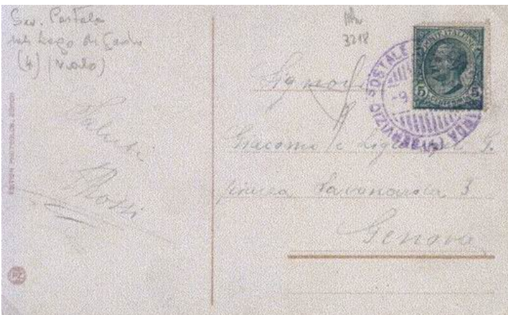
Foto 07. 9 settembre 1913. Bollo (4) in violetto su 5 c. di Vittorio Emanuele III su cartolina illustrata per Genova.