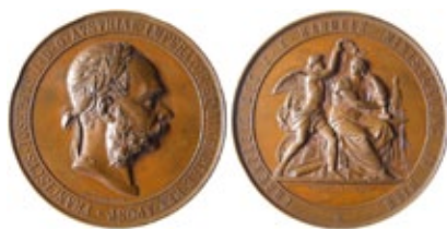
Medaglia per l'Esposizione Internazionale del 1873 Consegnata per meriti nel settore del commercio Rame – 93gr – Ø 56mm

(coniate perlopiù da privati o circoli sportivi e culturali) che, per amor dell'impero, hanno riportato il volto dell'imperatore secondo l'immagine propria dell'artista incisore.