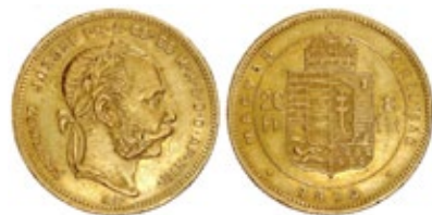
8 Fiorini 1874 Zecca di Vienna Circolazione per Ungheria Oro 900‰ – 6,45gr – Ø 21mm

Successivamente, dal 1892, l'Unione Monetaria Latina (UML) fece un ulteriore passo in avanti introducendo la nuova monetazione basata sulla Corona in argento