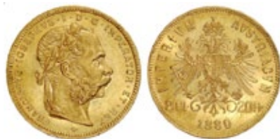
8 Fiorini 1880 Zecca di Vienna Circolazione per Austria Oro 900‰ – 6,45gr – Ø 21mm

L'uscita forzata dallo Zollverein nel 1866 (a causa della sconfitta nella guerra austro-prussiana) spinse l'Austria a cercare l'annessione all'Unione Monetaria Latina (presente già da alcuni decenni in altri stati europei quali Italia, Francia, Belgio e Svizzera). Così che dal 1870 l'Austria iniziò la produzione di monete da 4 e 8 fiorini in oro, equivalenti a 10 e 20 Franchi (o Lire), nel tentativo di attrarre investitori esteri grazie all'assenza di conversione della valuta.