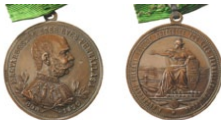
Doppia commemorazione in una medaglia ungherese: i 200 anni dell'associazione cittadina e i 1000 anni di regno ungherese

In tempi di guerra sono state prodotte molte medaglie vendute per sovvenzionare le finanze dei reparti bellici. Queste medaglie, vennero prodotte e vendute sul mercato con o senza scatoletta. Le prime avevano un costo dalle 6 alle 8 corone, quelle con scatola potevano raggiungere le 12 corone a seconda della finezza del materiale e della confezione.