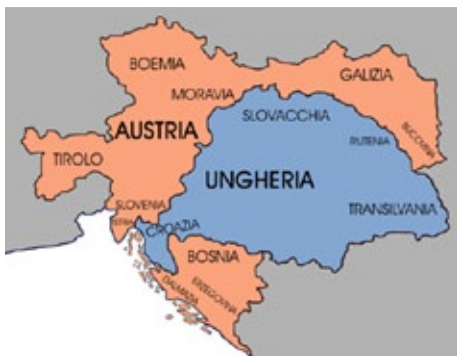
Impero Austro-ungarico e le sue 11 nazioni (dette etnie) nel 1866, al momento della sua formazione

venne annesso da lì a poco al Regno d'Italia) nonché venne estromessa dai rapporti economici e politici con i ducati danesi e dalla confederazione germanica.