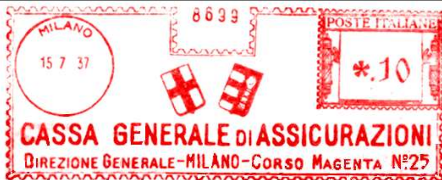
MI – Cassa Generale di Assicurazioni – impronta variata senza anno E.F. nel datario e cambio di indirizzo – Luigi Teti