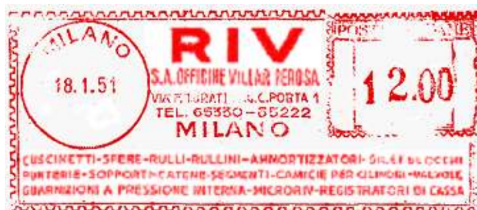
MI – RIV – indirizzi e telefoni modificati – Fabio Petri