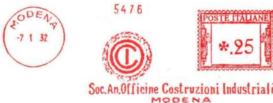
MO – Soc. An. Officine Costruzioni Industriali – (c.u. MO 30.01) aggiunta nel testo "MODENA" – Luigi Teti