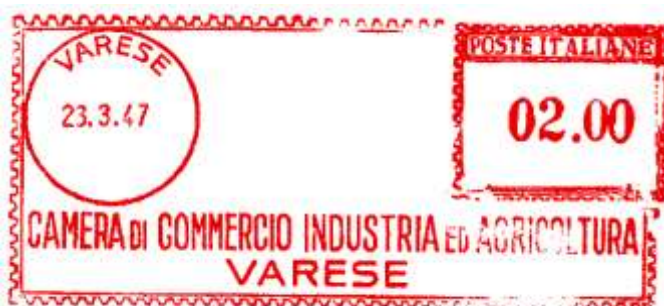
VA – Camera di commercio industria e agricoltura - (c.u. VA 40.04) testo modificato scalpellata e quattro valori – Fabio Petri