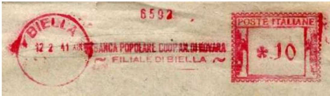
NO – Banca Popolare di Novara Filiale di Biella – (c.u. NO 41.04) nuova perché è censita la filiale di Galliate – Luigi Teti