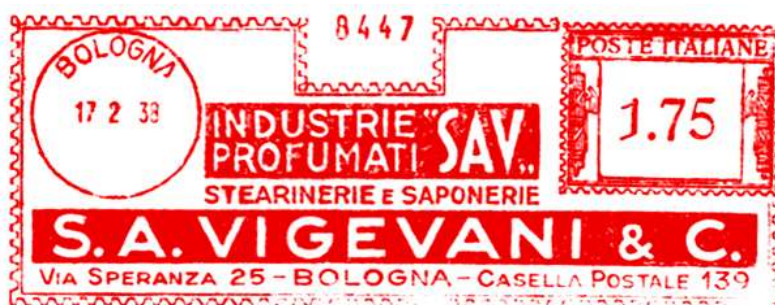
BO – SA. VIGEVANI & C. – (c.u. BO 37.02) impronta senza anno E.F. quindi precedente a quella in catalogo – Luigi Teti