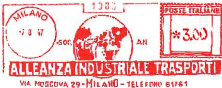
MI – Alleanza Industriale Trasporti – (c.u. MI 41.51) presenza di una cornice – Luigi Teti