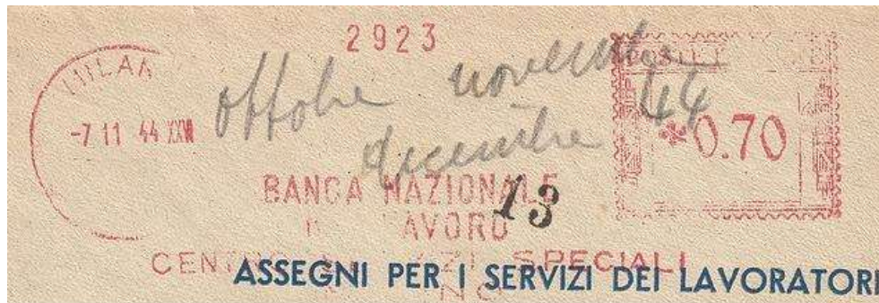
MI – Banca Nazionale del Lavoro – (c.u. MI 33.32) fasci e anno E.F. – Luigi Teti