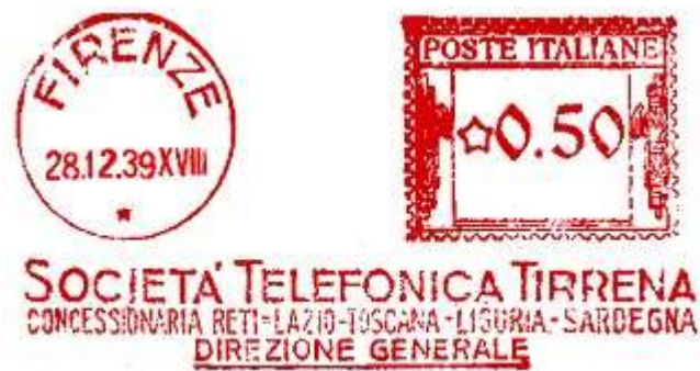
FI- Società Telefonica Tirrena – (c.u. FI 29.04) inserimento anno E.F. – S. De Benedictis