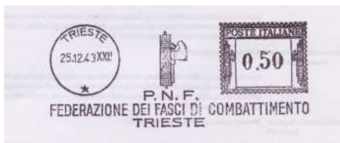
TS – Federazione dei Fasci di Combattimento – (c.u. TS 37.02) fascio più sottile TRIESTE senza trattini - Visentini