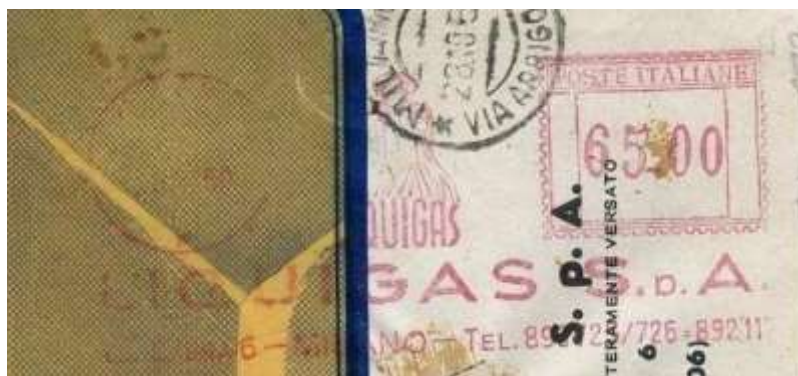
MI – Liquigas – (c.u. 42.30) aggiunto numero di telefono – Luigi Teti