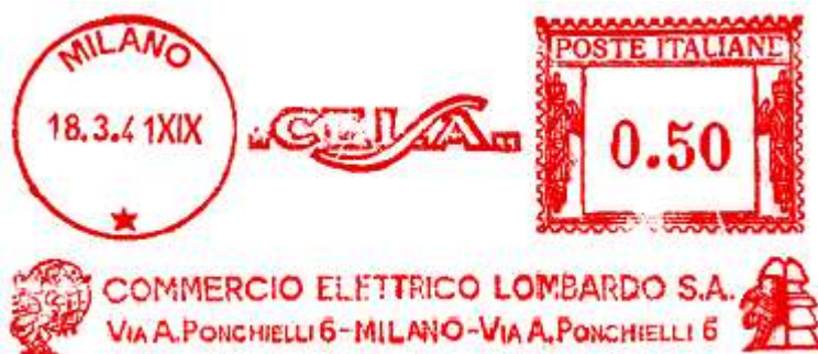
MI – Commercio Elettrico Lombardo – (c.u. MI 37.63) presenza dell'anno E.F. e 3 cifre nel punzone – Luigi Teti