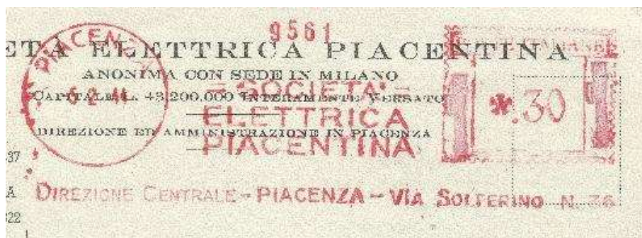
PC - Società Elettrica Piacentina – (c.u. PC 35.03) fasci rovesciati e numero civico modificato – Luigi Teti