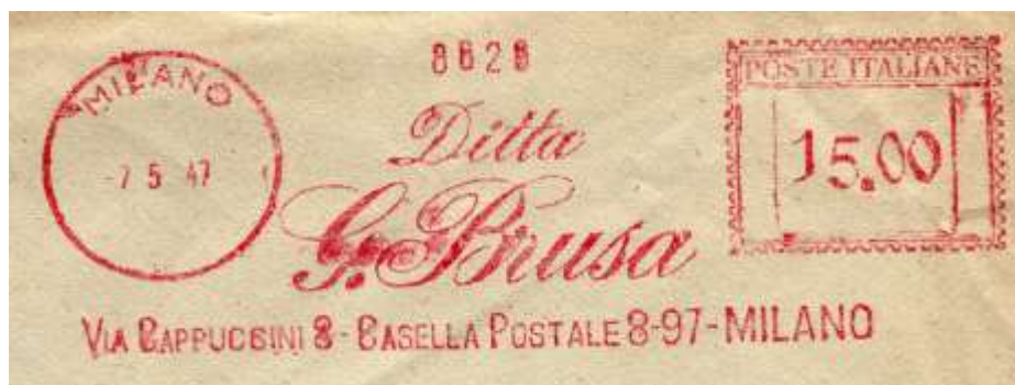
MI – G. Brusa – (c.u. MI 38.08) già censita ma mancante di immagine e scalpellata – Fabio Petrini