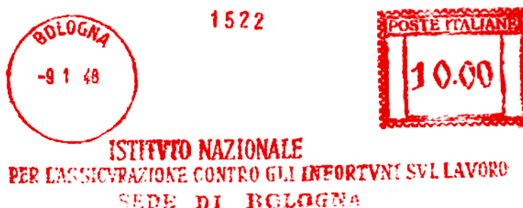
BO – Istituto Nazionale per l'Assicurazione contro gli Infortuni sul lavoro – (c.u. BO 40.09) eliminato lo stemma e 4 valori nel punzone – Luigi Teti