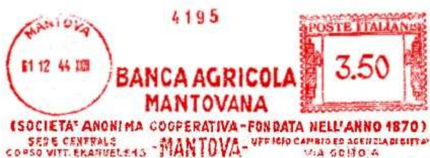
MN – Banca Agricola Mantovana – (c.u. MN 33.01) cornice eliminata – Fabio Petrini