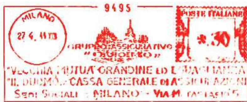
MI – VECCHIA MUTUA GRANDINE ED UGUAGLIANZA – (c.u. MI 29.37) descrizione come MI 29.37 d ma con fasci e anno E.F. – Fabio Petrini