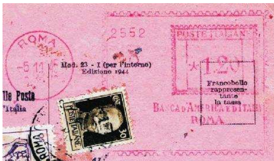
RM – Banca d'America e d'Italia – (c.u. RM 29.01) scalpellata e senza anno E.F. – Luigi Teti