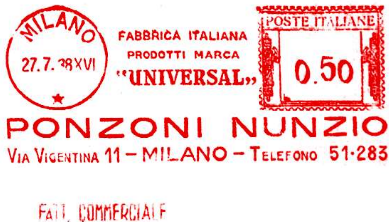
MI – Ponzoni Nunzio – (c.u. MI 34.24) inserimento anno E.F. – S. De Benedictis