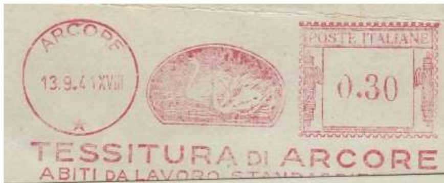
Mi – Tessitura di Arcore – (c.u. MI 37.67) il punzone risulta valorizzato – S. De Benedictis