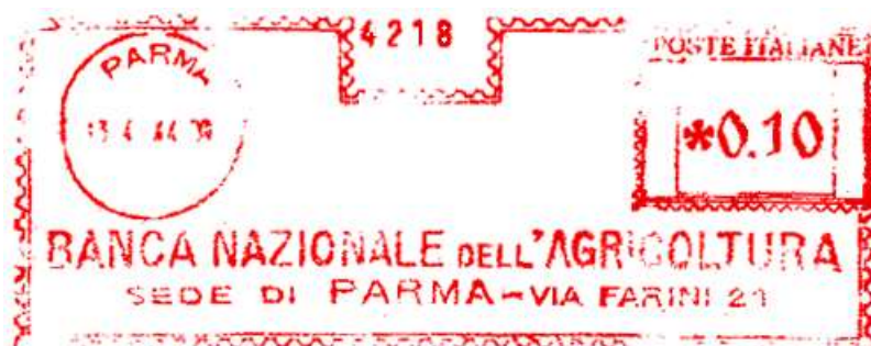
PR – Banca Nazionale dell'Agricoltura – (c.u. PR 33.01) anno E.F. scalpellato ma senza spostare la data – Luigi Teti