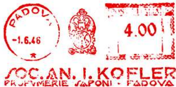
PD – Soc. An. Kofler – (c.u. PD 30.07) scalpellata – Luigi Teti