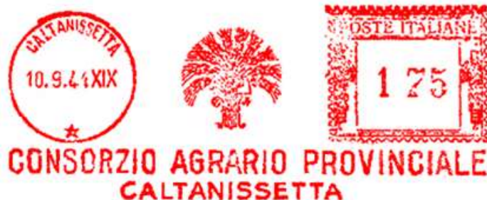
CL – Consorzio Agrario Provinciale – (c.u. CL 39.01) censita ma senza immagine – Luigi Teti