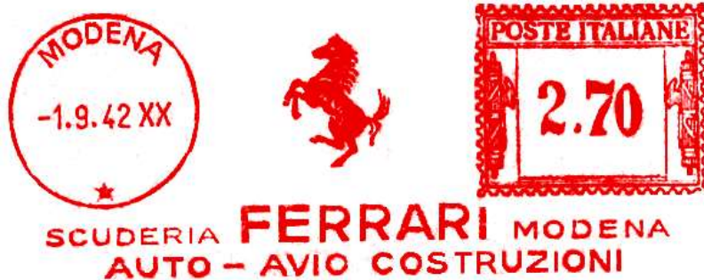
MO – Ferrari Auto Avio costruzioni – (c.u. MO 42.02) impronta nuova – Luigi Teti