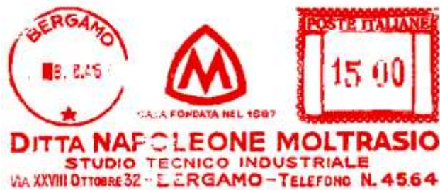
BG – Moltrasio Napoleone – (c.u. BG 41.04) scalpellata e 4 valori nel punzone – Luigi Teti