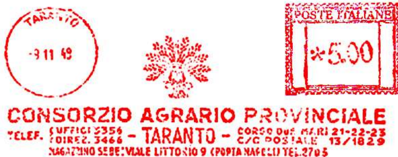
TA – Consorzio Agrario Provinciale – (c.u. TA 41.03) censita senza immagine – Luigi Teti