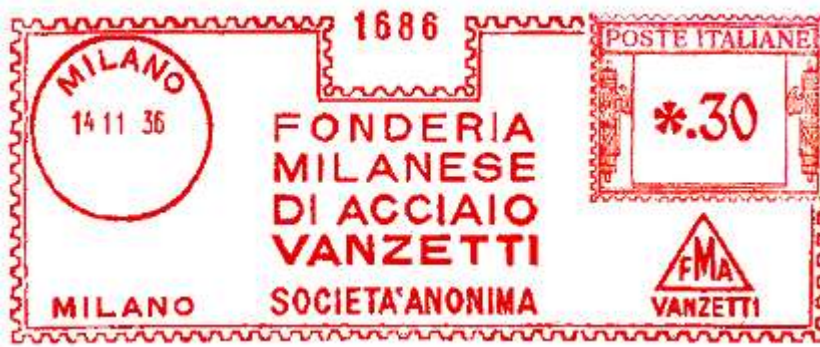
MI – Fonderia Vanzetti – (c.u. MI 34.05) era catalogata ma senza immagine – S. De Benedictis