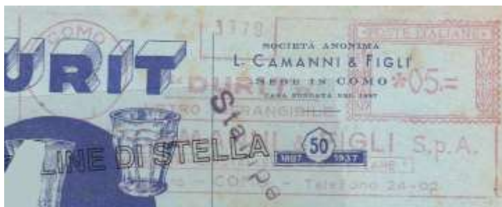
CO – Durit – impronta nuova non censita – Luigi Teti