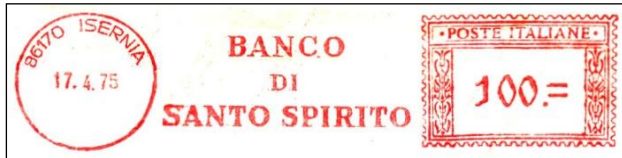
b– nuova macchina 4 valori