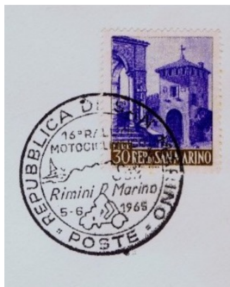
Annulli speciali sammarinesi utilizzati per celebrare i Rallye Internazionale Motociclistico organizzati nel 1953 e nel 1965