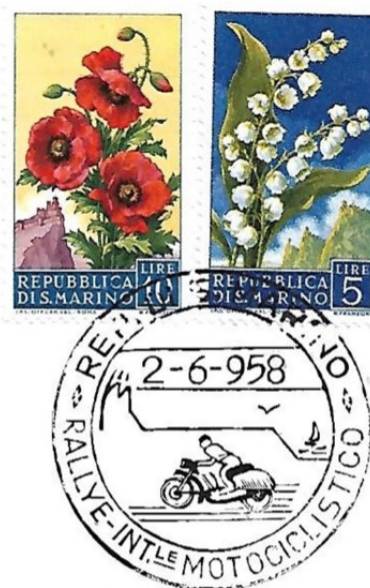
Cartolina ed annullo speciale italiano celebrativi del IX Rallye Internazionale Motociclistico RIMINI – SAN MARINO