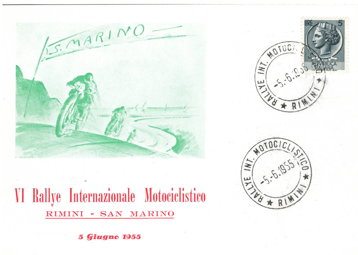
Cartolina ed annullo speciale italiano celebrativi del VI Rallye Internazionale Motociclistico RIMINI – SAN MARINO

Oltre a dare i natali ad un due volte Campione del Mondo di motociclismo del quale abbiamo già parlato nella seconda parte di questo lavoro, MANUEL POGGIALI, la piccola Repubblica incastonata tra il territorio pesarese e quello romagnolo non solo ha organizzato manifestazioni motoristiche sul suo piccolo territorio ma ha anche patrocinato manifestazioni motoristiche di livello mondiale svoltesi su circuiti vicini (Misano ed Imola).