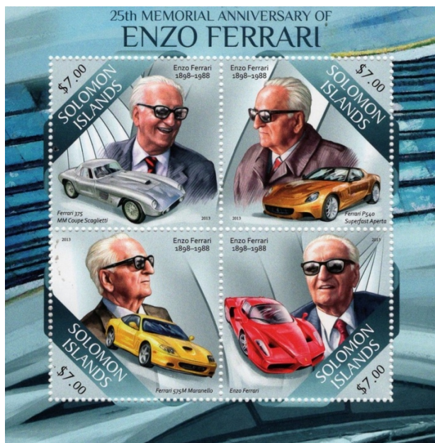
Enzo Ferrari raffigurato su un foglietto emesso da Solomon Islands nel 2013

Inizialmente e fino al 2006 la denominazione era “ Circuito Internazionale Santamonica ”, dal 2006 al 2012 semplicemente “ Misano World Circuit ”. Dal 2012 ha acquisito l'attuale denominazione in omaggio alla memoria del pilota conterraneo tragicamente deceduto in pista Marco Simoncelli.