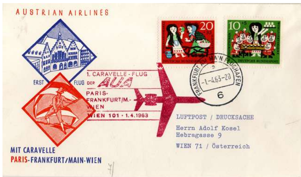
01.04.1963 A.U.A. AUSTRIAN AIRLINES 1° volo PARIGI (Francia)- FRANCOFORTE (Germania) – Vienna (Austria) con Caravelle . Corrispondenza indirizzata a Vienna. A sinistra al centro il timbro speciale a ricordo dell'apertura della nuova linea aerea.