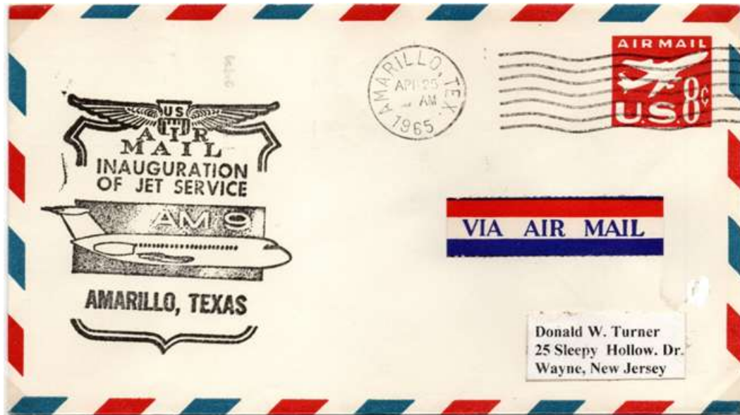
25.04.1965 1° volo AMARILLO (TEXAS) – Wayne (New Jersey) con AM 9. Busta indirizzata a Wayne New Jersey Annullo celebrativo del volo a sinistra della busta color nero Timbro di transito di Houston (Texas) del 25.04.1965 retro busta.