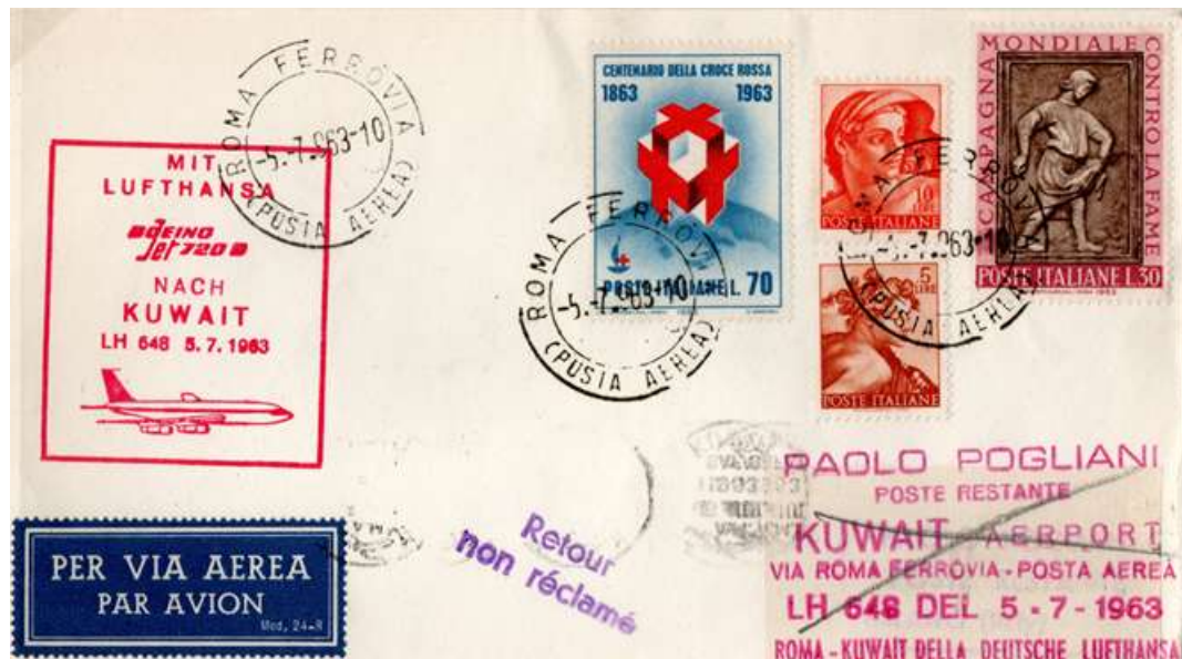
05.07.1963 LUFTHANA 1° volo ROMA (Italia) – KUWAIT CITY (Kuwait) Corrispondenzadiretta a Kuwait city A sinistra in alto l'annullo in rosso a ricordo dell'apertura della nuova linea aerea