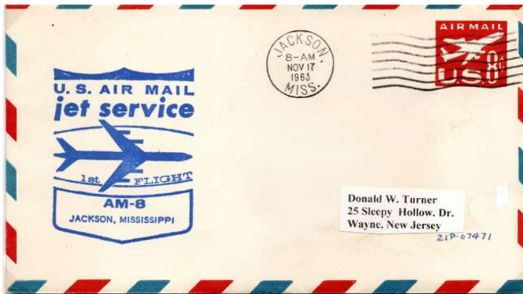
17.11.1963 1° volo JACKSON (MISSISSIPPI) – Wayne (New Jersey) con AM 8. Busta indirizzata a Wayne New Jersey Annullo celebrativo del volo a sinistra della busta color azzurro. Timbro di transito di Newark Airport New York del 17.11.1963 retro busta.