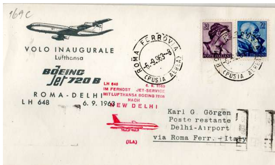
06.09.1963 LUFTHANA 1° volo con Boeing Jet 720 B ROMA (ITALIA) – NUOVA DELHI (India) Corrispondenza diretta a Nuova Delhi. Al centro l'annullo in rosso a ricordo dell'apertura della nuova linea aerea.