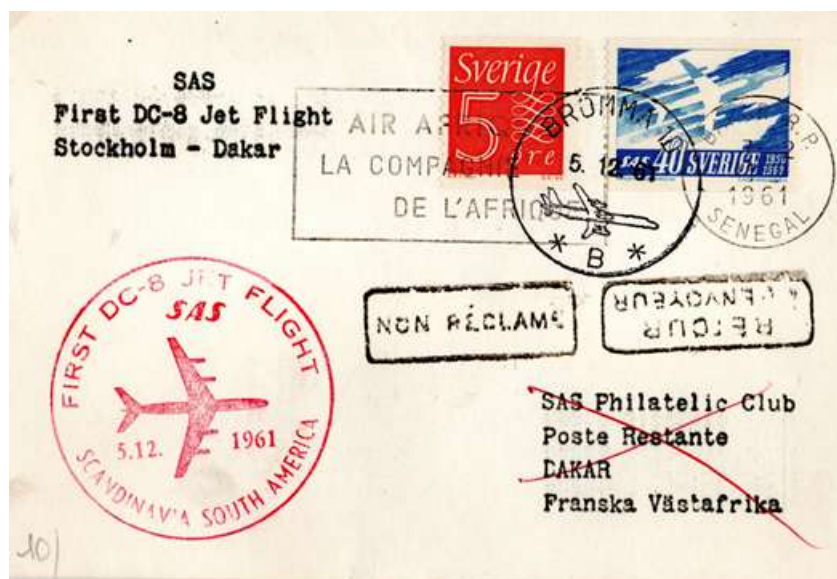
05.12.1961 S.A.S. CANDINAVIAN AIRLINES SYSTEM 1° volo STOCOLMA (Svezia)- DAKAR (Senegal) con DC 8