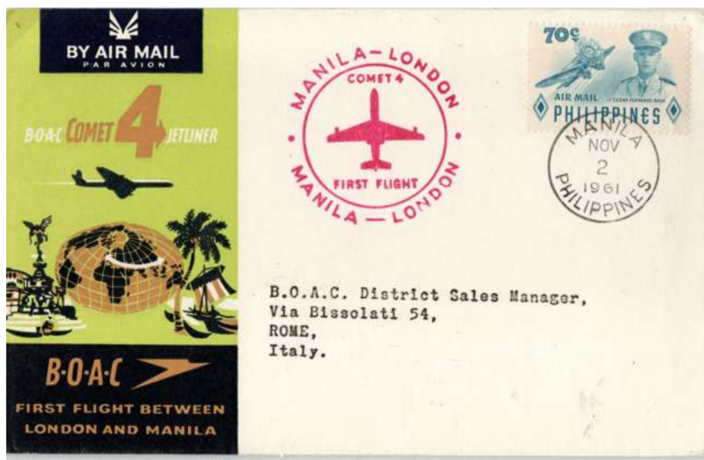
02.01.1961 B.O.A.C. BRITISH OVERSEAS AIRWAYS COORPORATION 1° volo LONDRA (Inghilterra) – MANILA (Filippine) con Comet 4 JETLINE