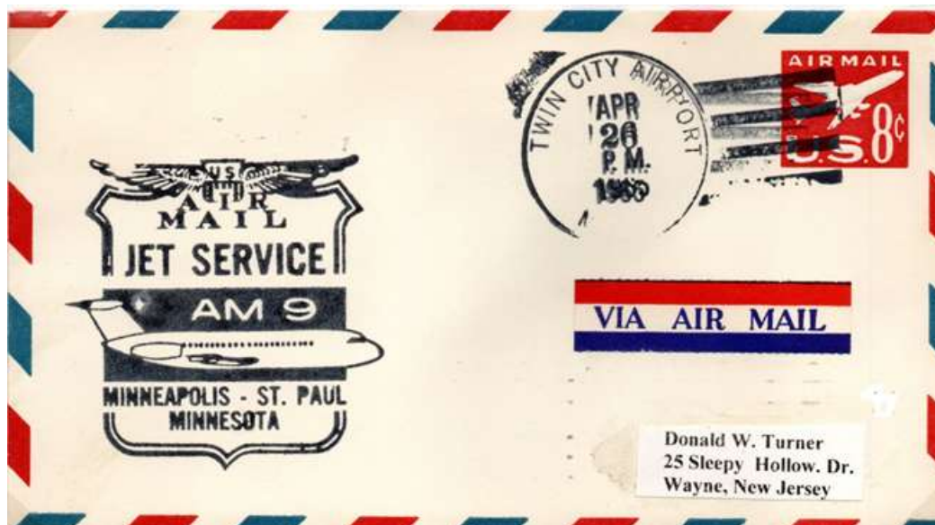
25.04.1965 1° volo MINNEAPOLIS – ST. PAUL MINNESOTA Texas) – WAYNE (New Jersey) con AM 9. Busta indirizzata a Wayne New Jersey Annullo celebrativo del volo a sinistra della busta color verde Timbro di transito di Saint Louis del 26 .04.1965 retro busta.