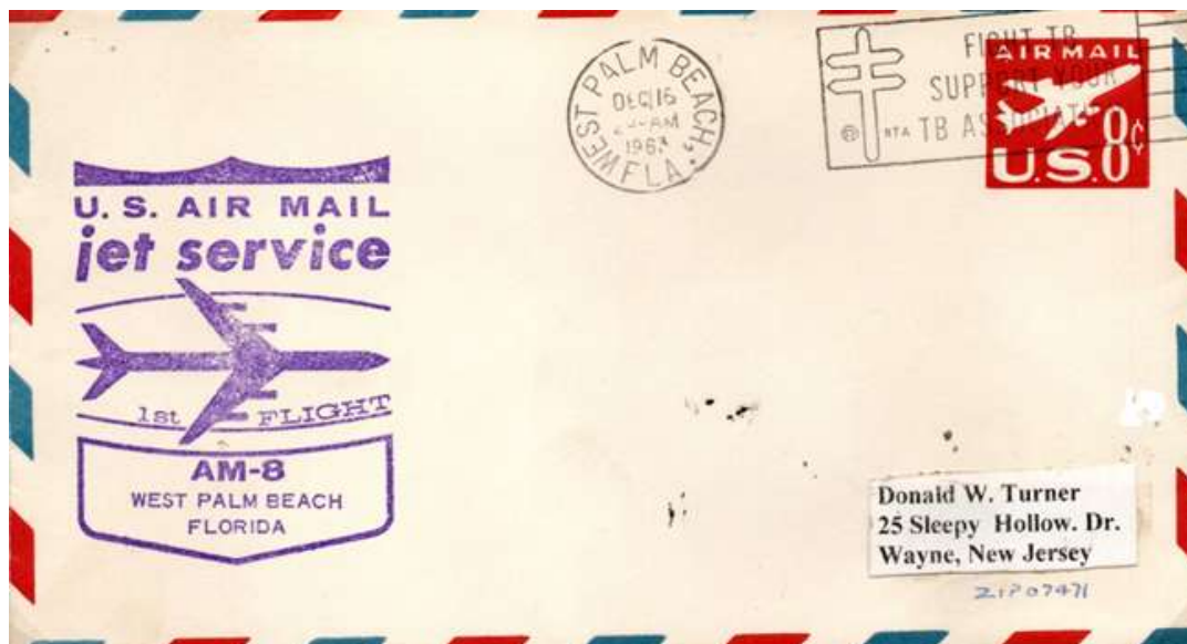
15.12.1963 1° volo WEST PALM BEACH (Florida) – Wayne (New Jersey) con AM 8. Busta indirizzata a Wayne New Jersey Annullo celebrativo del volo a sinistra della busta color viola. Timbro di transito di Miami (Florida) del 17.12.1963.