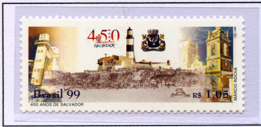
Città di Salvador de Bahia