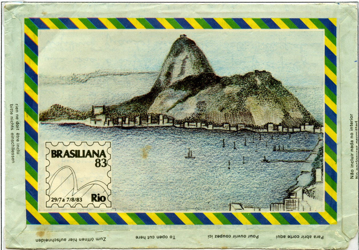
Brasile 1983 - aerogramma per l'estero raffigurante la città di Rio de Janeiro.

Agli inizi del '900 Rio de Janeiro divenne la capitale del Brasile e molti baiani si trasferirono in questa città.