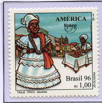
Costume tipico delle donne bahiane

Fu proprio una donna proveniente da Salvador de Bahia, Tia Ciata a propiziare l'incisione su disco del primo brano di samba.