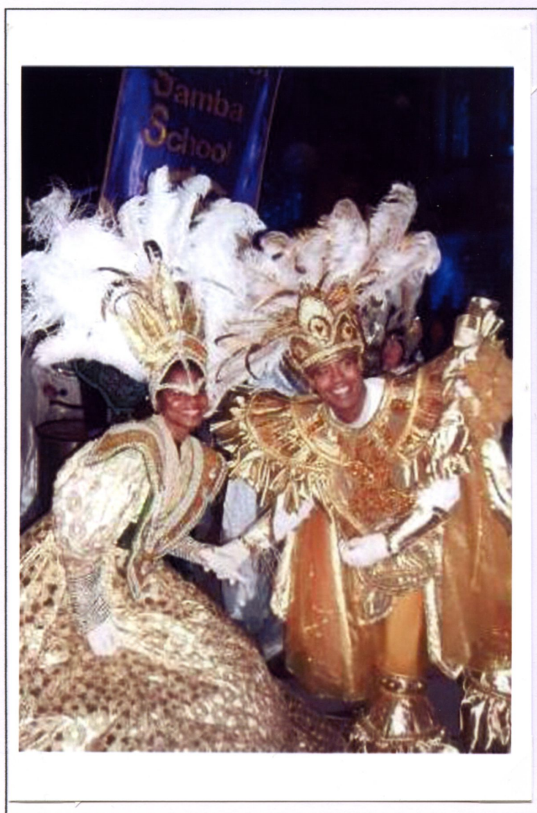
Cina 2009 - cartolina postale

Quando si parla di samba, il nostro pensiero va al Brasile, luogo in cui questo genere musicale e il relativo ballo è nato, e in particolare alla città di Rio de Janeiro, che l'ha reso celebre in tutto il mondo.