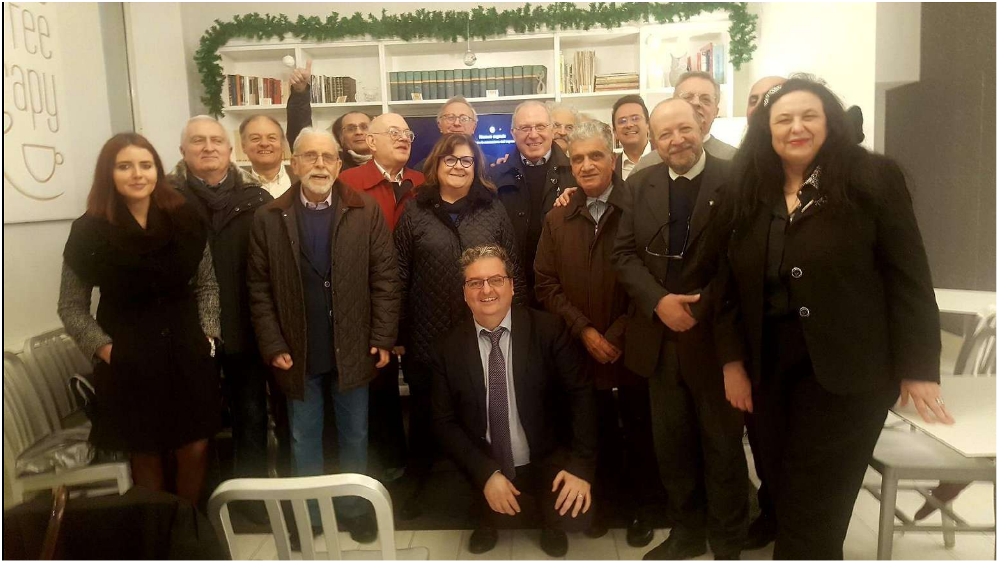
Foto di gruppo VI Edizione Salernophil