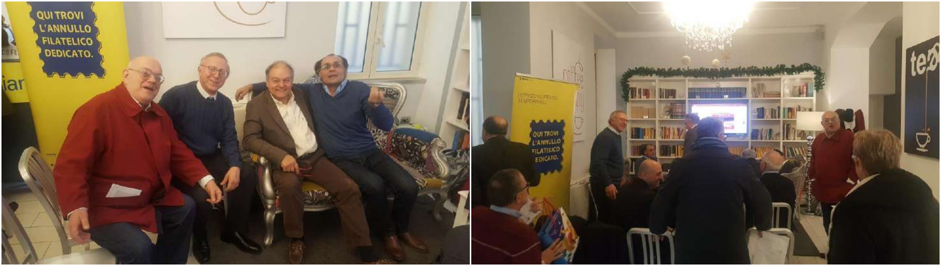
Alcuni momenti del convegno