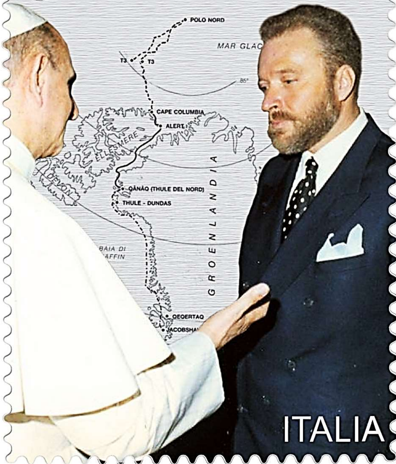
Guido Monzino durante l'incontro con Paolo VI avvenuto dopo l'impresa del 1971. Sullo sfondo il percorso seguito da Monzino per raggiungere il Polo Nord.