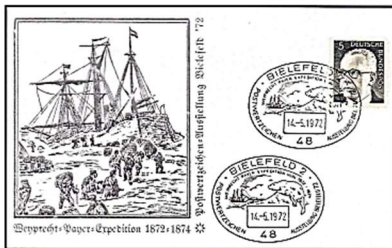
1872-2022: 150 Jahre Weyprecht-Payer-Expedition Sonderstempel vor 50 Jahren