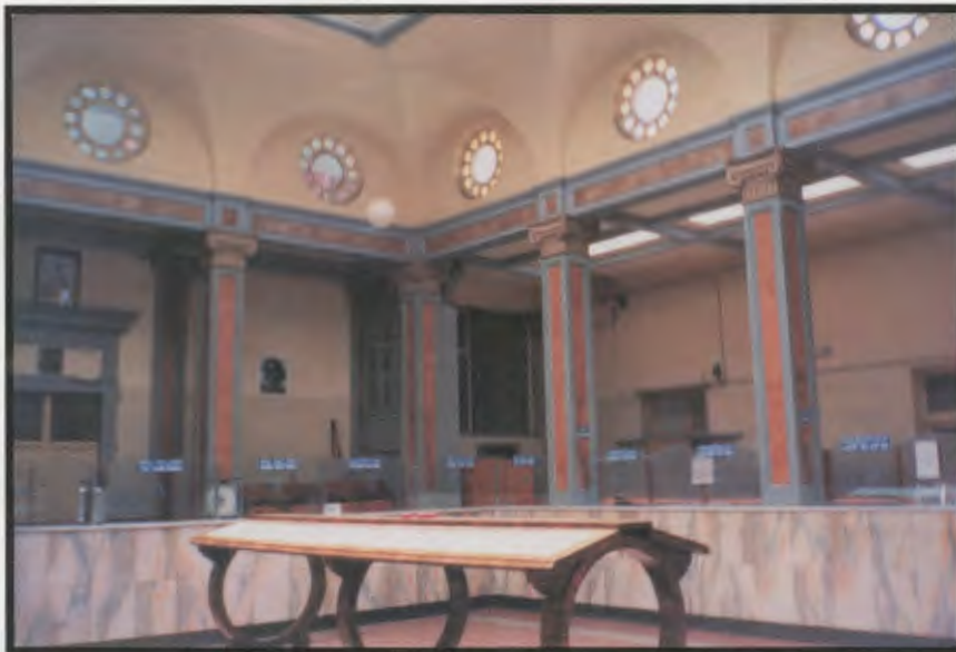
Asmara. Il salone interno del palazzo delle Poste.