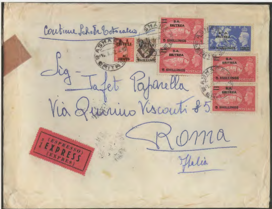
12 dicembre 1951. Busta di lettera per espresso via aerea dall'Asmara per Roma, affrancata con sei francobolli per 35 scellini e 60 centesimi fra i quali un 5 scellini ed una striscia di tre esemplari del 10 scellini. Al verso il bollo di arrivo di Roma del 13.12.51.