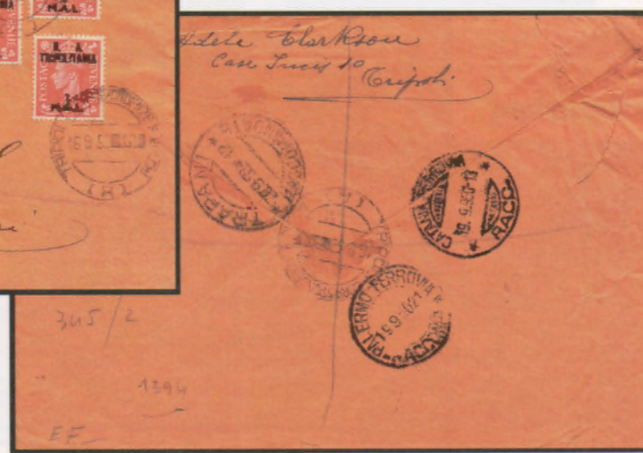
16 settembre 1950. Busta di lettera raccomandata via aerea da Tripoli a Trapani, affrancata con dieci esemplari del 2 mal. Al verso bolli di transito e bollo di arrivo di Trapani del 20.9.50.