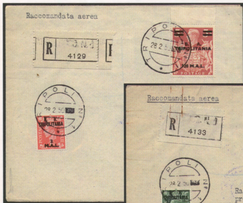
28 febbraio 1950. Busta di lettera filatelica inoltrata per raccomandata via aerea da Tripoli per Milano, affrancata con un 2 mal e un 120 mal. Al verso bolli di transito e bollo di arrivo di Milano del 3.3.50.

La prima data d'uso su corrispondenza viaggiata è del 27 febbraio 1950; le ultime date d'uso sono dei primi giorni di dicembre del 1951.