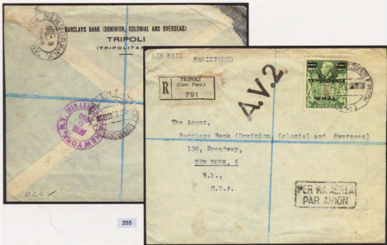
4 agosto 1950. Busta di lettera raccomandata via aerea da Tripoli a New York, affrancata con un 60 mal. Al verso bolli di transito e di arrivo di New York del 9.8.50.