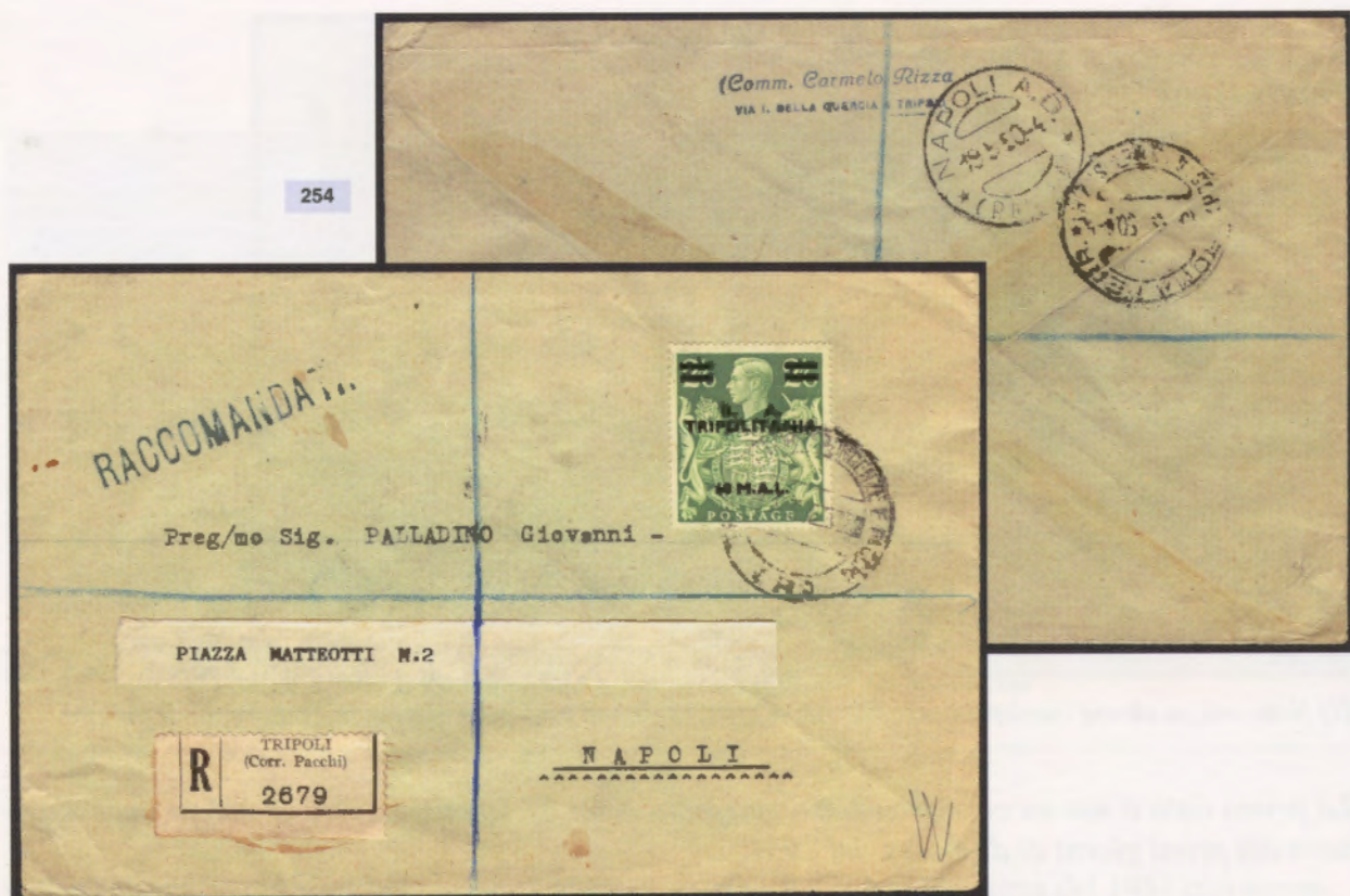
10 maggio 1950. Busta di lettera raccomandata da Tripoli a Napoli, affrancata con un 60 mal. Al verso bolli di transito e bollo di arrivo di Napoli del 19.5.50.