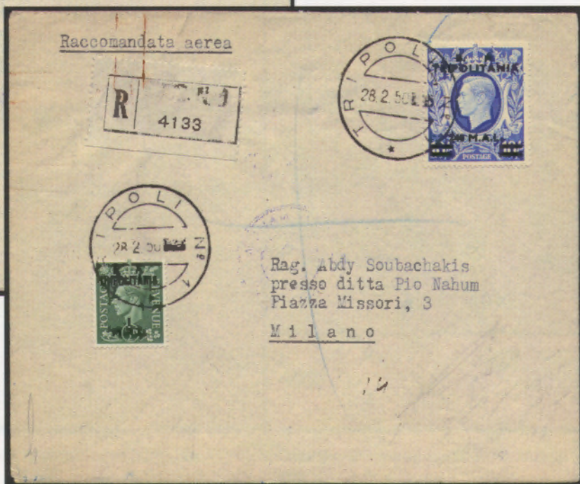
28 febbraio 1950. Busta di lettera filatelica inoltrata per raccomandata via aerea da Tripoli per Milano, affrancata con un esemplare da 1 mal e uno da 240 mal. Al verso bolli di transito e bollo di arrivo di Milano del 3.3.50.

Rag. Abdy Soubachakis presso ditta Pio Nahum Piazza Missori, 3 Milano