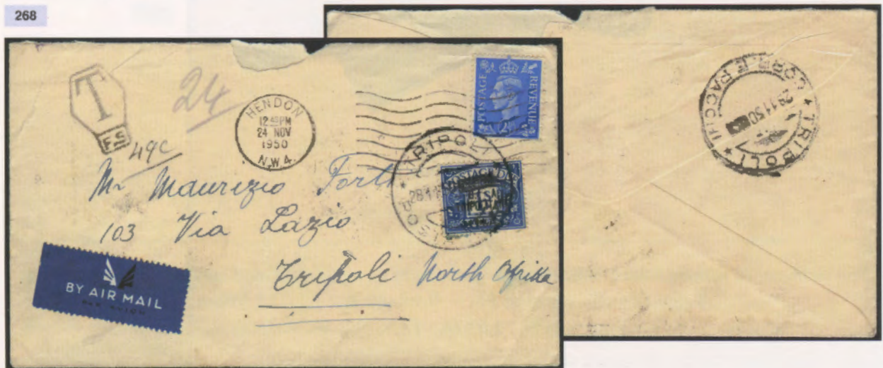
24 novembre 1950. Busta di lettera via aerea da Hendon a Tripoli insufficientemente affrancata con un 2 1/2 di Gran Bretagna. Tassata in arrivo con un segnatasse da 1 scellino obliterato con il bollo di Tripoli 28.1.51.