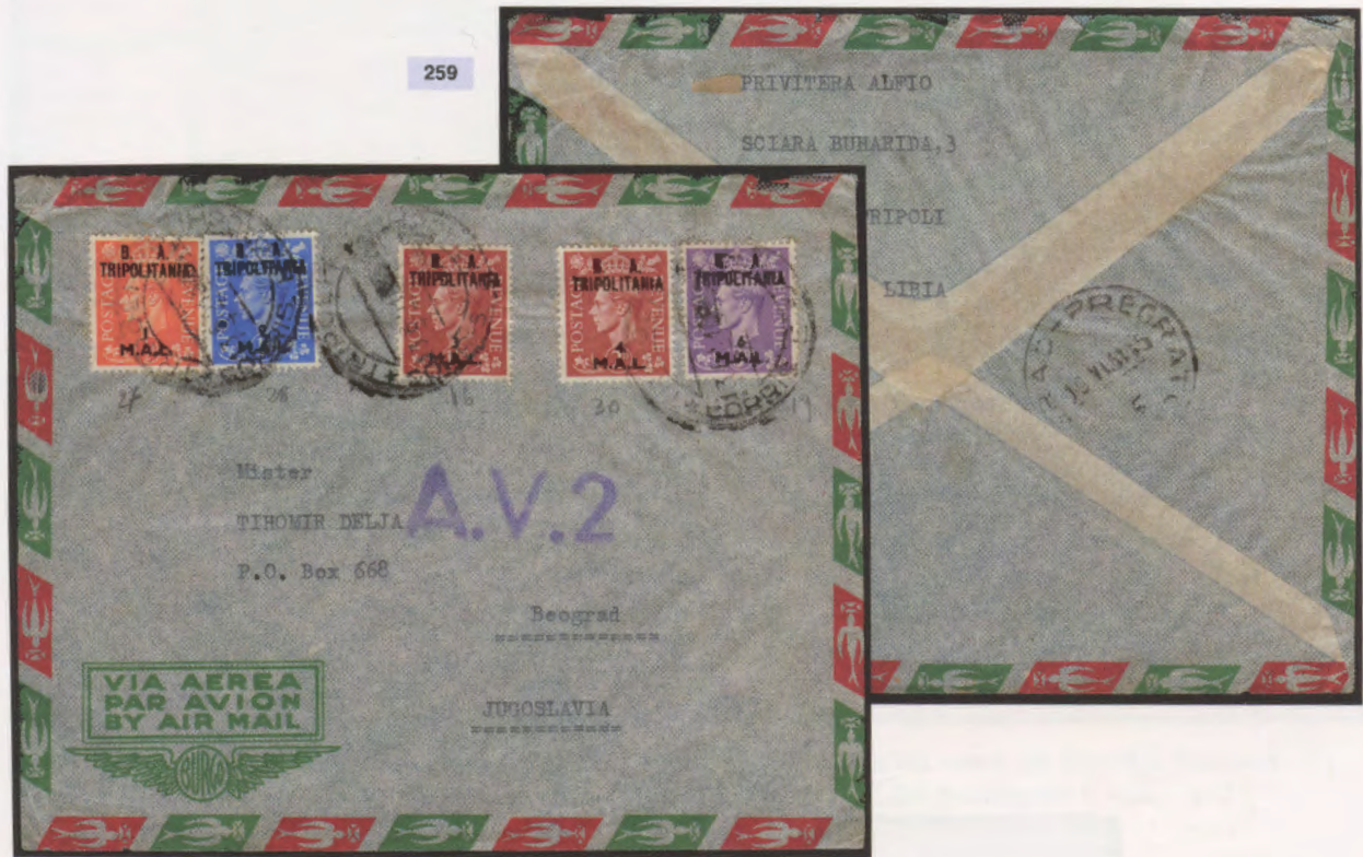
13 giugno 1951. Busta di lettera via aerea da Tripoli a Belgrado affrancata con 1 mal, 2 mal, 3 mal, 4 mal e 6 mal. Al verso bollo di arrivo di Belgrado 19.6.45.

La prima data d'uso su corrispondenza viaggiata è del 27 febbraio 1950. Sono indicate come primo giorno d'uso due corrispondenze filateliche con bollo di inoltro del 4 giugno 1951. L'ultima data d'uso finora conosciuta è del 15 dicembre 1951. È segnalata una corrispondenza del 22 gennaio 1951 con bollo di arrivo del 23 gennaio.