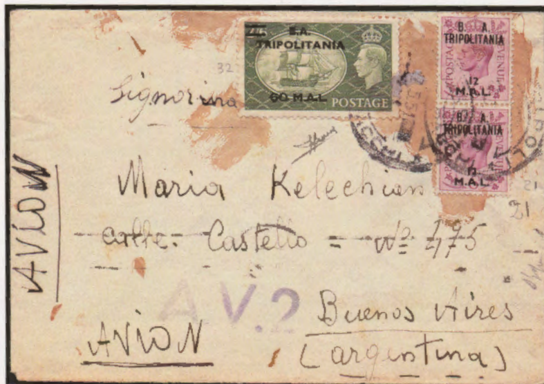
17 maggio 1951. Busta di lettera via aerea da Tripoli a Buenos Aires, affrancata con due valori da 12 mal ed uno da 60 mal. Al verso bollo di arrivo di Buenos Aires.