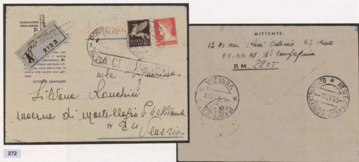
5 maggio 1942. Busta di lettera raccomandata inoltrata dall'ufficio della posta militare N. 220 diretta a Venezia affrancata per 2,25 lire. Al verso il bollo di arrivo del 9.5.42.