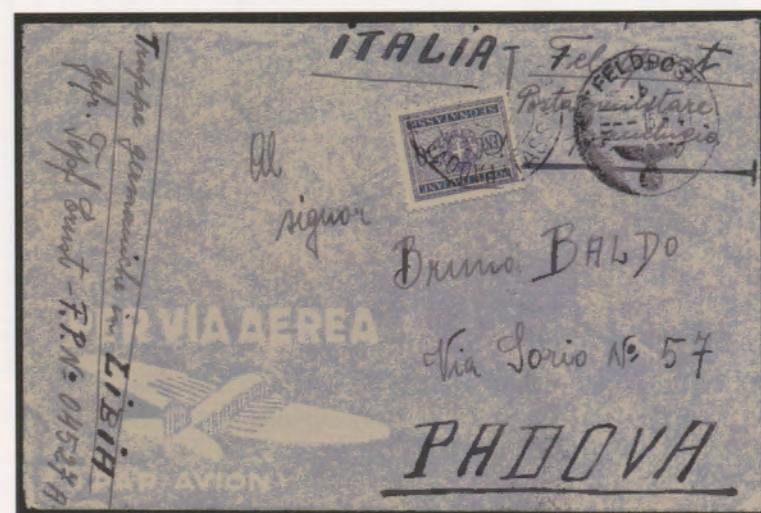
15 giugno 1941. Busta di lettera di un militare operante in Libia presso un reparto tedesco, inoltrata tramite la Feldpost e diretta a Padova. Nonostante il bollo di franchigia della Feldpost e l'indicazione sul frontespizio, la lettera venne tassata dall'ufficio di Padova per il porto semplice con un segnatasse da 50 centesimi.