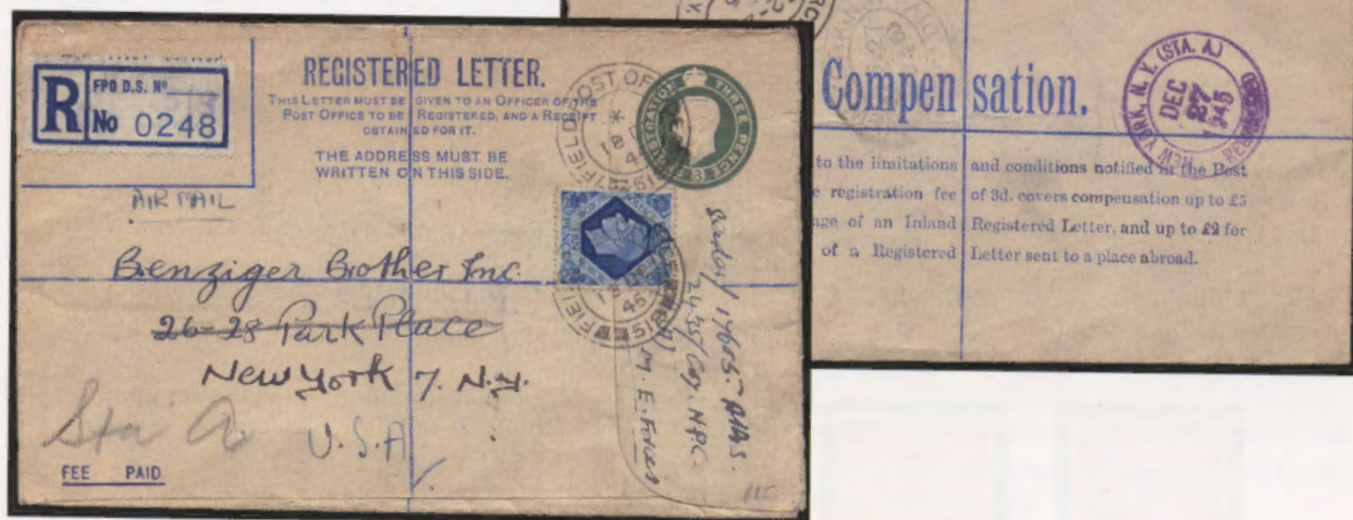
18 dicembre 1945. Busta postale a raccomandazione fissa con affrancatura aggiuntiva di 9 d. inoltrata dall'ufficio di posta militare "F.P.O. 518", dislocato in Cirenaica a Bengasi, diretta a New York. Al verso bolli di transito e bollo di arrivo di New York del 27.12.45.