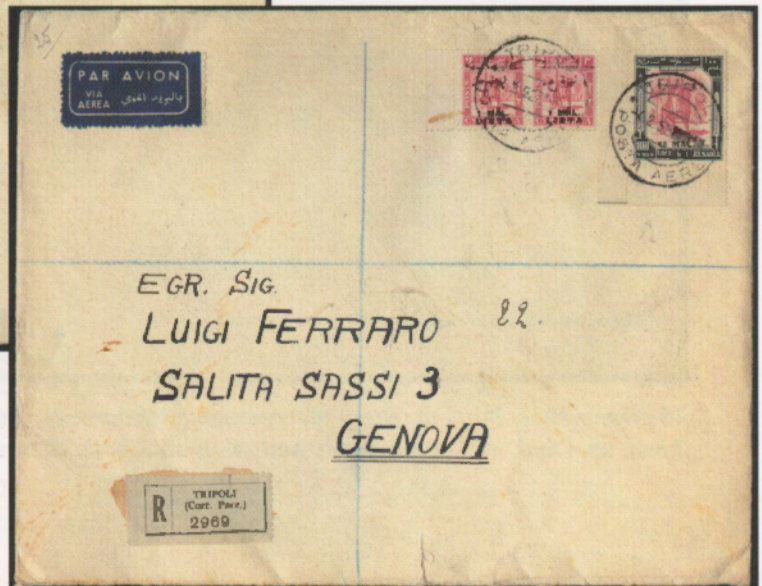
4 febbraio 1952. Busta di lettera raccomandata via aerea da Tripoli a Genova affrancata con una coppia del 2 mal e un 48 mal. Al verso il bollo di transito di Roma e di arrivo Genova 5.2.52.