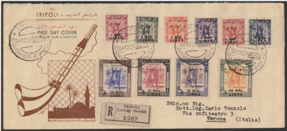
24 dicembre 1951. La serie completa dei 10 valori su busta filatelica raccomandata via aerea da Tripoli a Verona. Al verso il bollo di arrivo di Verona del 5.1.52.