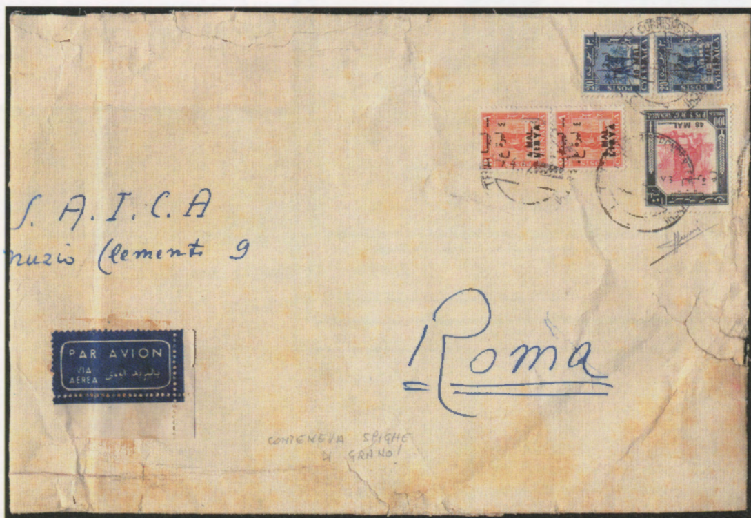
7 aprile 1952. Busta via aerea contenente un campione senza valore da Tripoli a Roma, affrancata con due 4 mal, due 10 mal ed un 48 mal.