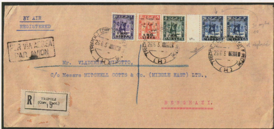
26 giugno 1952. Busta di lettera raccomandata via aerea da Tripoli a Bengasi, affrancata con un 2 mal, un 4 mal, un 5 mal e due 10 mal. Al verso il bollo di arrivo di Bengasi del 30.6.52.