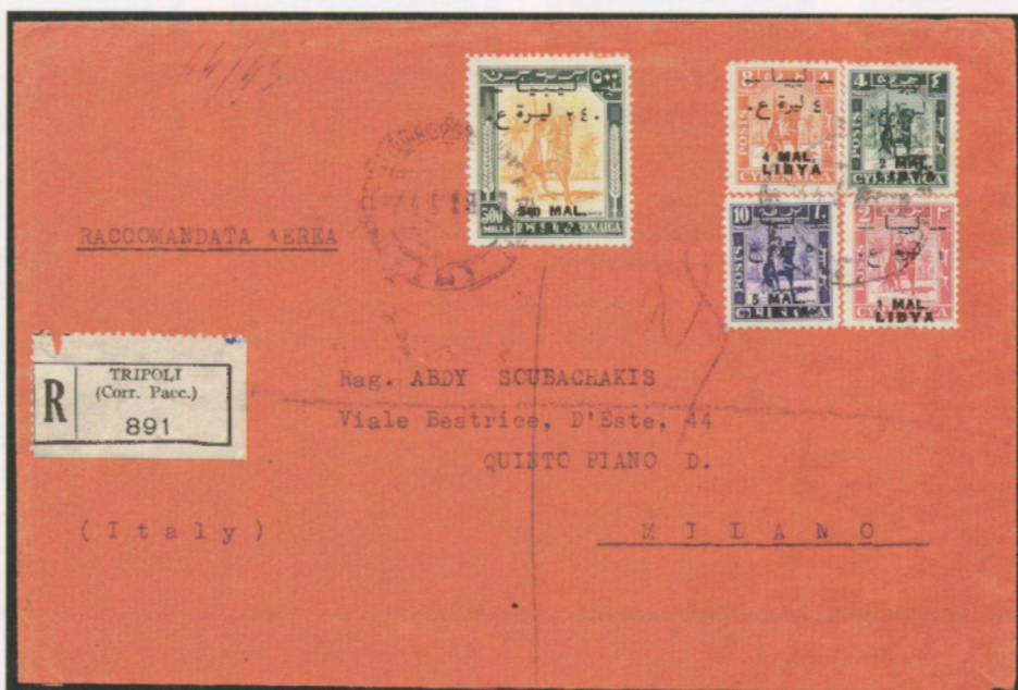
3° aprile 1952. Busta di lettera raccomandata via aerea da Tripoli a Milano, affrancata con un valore da 1 mal, un 2 mal, un 4 mal, un 5 mal ed un 240 mal. Al verso il bollo di arrivo di Milano del 4.4.52.