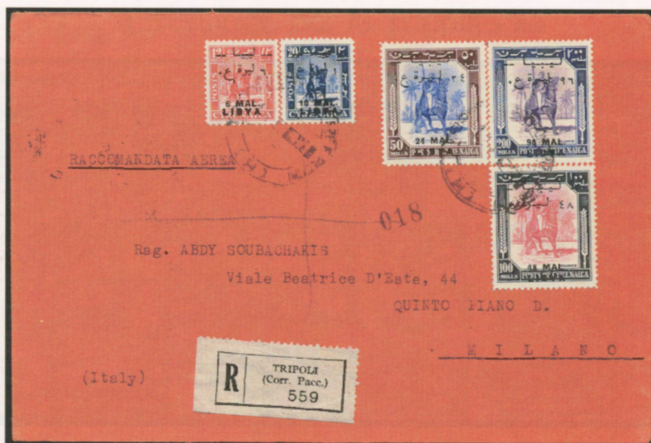
1° aprile 1952. Busta di lettera raccomandata via aerea da Tripoli a Milano, affrancata con un 6 mal, un 10 mal, un 24 mal, un 48 mal ed un 96 mal. Al verso il bollo di arrivo di Milano del 4.4.52.