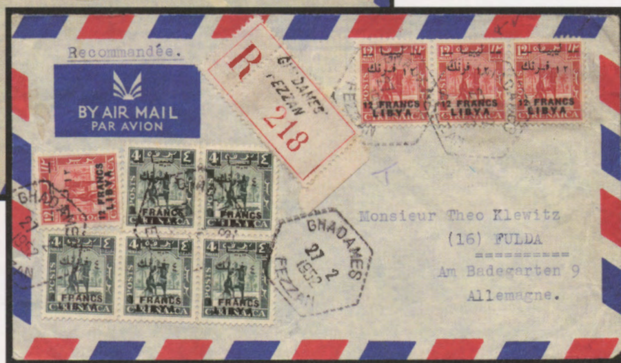
27 febbraio 1952. Busta di lettera raccomandata via aerea da Ghadames per la Germania affrancata con cinque valori del 4 fr. e quattro valori del 12 fr. Al verso il bollo di arrivo di Ghadames 1.3.52.