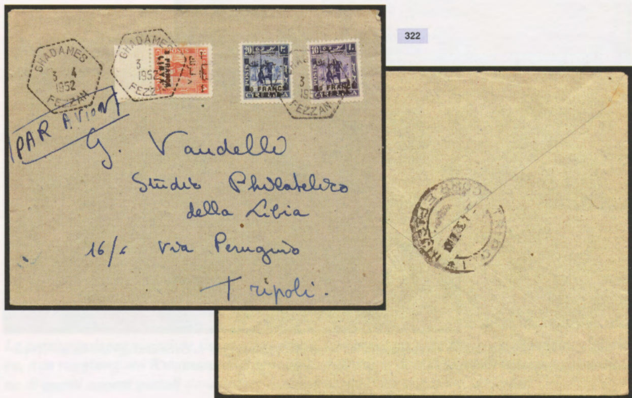
3 aprile 1952. Busta di lettera via aerea da Ghadames a Tripoli, affrancata con un 8 fr. un 10 fr. ed un 20 fr. Al verso il bollo di arrivo di Tripoli.