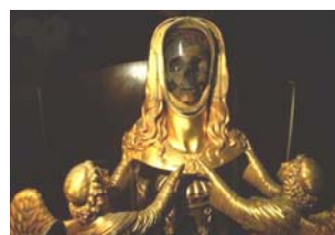
Il reliquiario con il teschio di Maria Maddalena